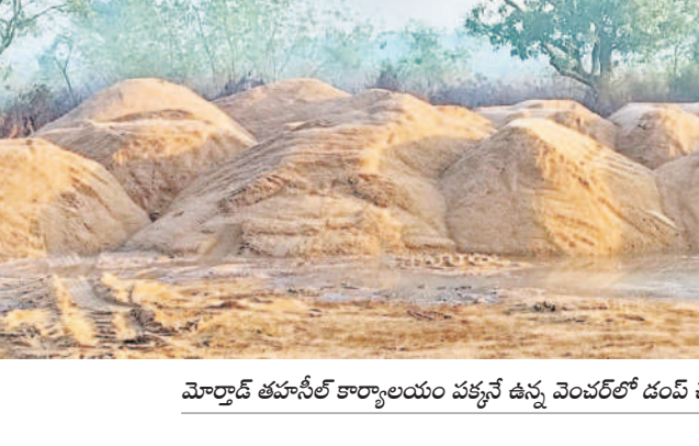
మోర్రాడ్ తహసీల్ కార్యాలయం పక్కనే ఉన్న వెంబర్లో డంప్ చేసిన ఇసుక

డంప్ చేస్తున్నందుకు రూ.5 లక్షలు, అధికారులకు భారీగా ముడుపులు చెల్లించిన అధికార పార్టీ నేతలు బీకటి పడితే చాలు పెద్దవారులో జేసీబీలు, డ్రాక్టర్లతో వాటిపోతున్నారు. జాతీయ రహదారి మీదుగానే తరలింపుకు పోతున్నారు. రెవెన్యూ, పోలీసు అధికారులను మద్దతు చేసుకోవడంతో వారు పట్టించుకోవడం లేదు. ఈ వ్యవహారంపై 'నమస్తే తెలంగాణ' వరుస కథనాలు ప్రచురించడం, కలెక్టర్ సీరియస్ కావడంతో కదిలిన రెవెన్యూ అధికారులు సోమవారం డంప్లు సీజ్ చేసి నట్లు హామీచేశారు. కానీ, అదే రోజు రాత్రి మళ్లీ పెద్దవారు గుంపు ఇసుక తవ్వకాలు యధేచ్ఛ జరిగాయి. మంగళవారం ఉదయం వరకూ తరలింపు ఇసుకను తహసీల్ కార్యాలయం పక్కనే ఉన్న వెంబర్లో డంప్ చేశారు. అయినా అటువైపు ఎవరూ కన్నెట్టి చూడలేదు.