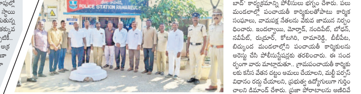
రామారెడ్డిలో గ్రామ పంచాయతీ సిబ్బందిని ముందస్తు అరెస్టు చేసిన పోలీసులు