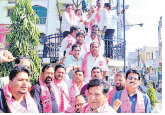
కామారెడ్డి జిల్లా కేంద్రంలో..