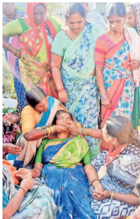
ధర్నాలో సామ్మసిల్లి పడిపోయిన కార్మికులు

అదిబట్ల, డిసెంబర్ 17 : పెండింగ్ లో ఉన్న గౌరవ వేతనాలు, గుడ్ల బిల్లులను వెంటనే విడుదల చేయాలని, ఎన్నికల్లో ఇచ్చిన హామీ ప్రకారం రూ.10వేల వేతనం ఇవ్వాలని మధ్యాహ్న భోజన కార్మికులు కలెక్టరేట్ ఎదుట చేపట్టిన ధర్నా రెండోరోజూ మంగళవారం కొనసాగింది. ధర్నాలో ఓ కార్మికురాలు సామ్మసిల్లి పడిపోగా, పోలీసులు దవాఖానాకు తరలివారు. అనంతరం ఆ సంఘం నాయకులు మాట్లాడుతూ ప్రతి స్కూల్కూ గ్రాన్ సిలిండర్ ఇవ్వాలని, యూనిఫాంలు, గుర్తింపు కార్డులూ అందజేయాలని ప్రభుత్వాన్ని డిమాండ్ చేశారు. మధ్యాహ్న భోజన నిర్వహణను అక్షయమాత్ర వంటి స్వచ్ఛంద సంస్థలకు అప్పజెప్పవద్దని కోరారు. ప్రమాద బీమా, పీఎఫ్, ఈఎఫ్ఐ సౌకర్యాలను కల్పించాలని డిమాండ్ చేశారు. ఎలాంటి షరతులు లేకుండా బ్యాంక్ లనుంచి రుణాలను తీసుకునే సౌకర్యం కల్పించాలన్నారు. కార్యక్రమంలో మధ్యాహ్న భోజన కార్మికులు పెద్ద ఎత్తున పాల్గొన్నారు.