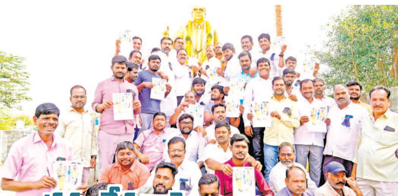
కడ్రాల్ మండల కేంద్రంలో అంబేద్కర్ విగ్రహానికి వినతి పత్రం అందజేసిన అనంతరం రైతుకు బేడిలు వేసి దవాఖానాకు తీసుకెళ్ళున్న ఫోటోలను చూపుతూ నిరసన తెలుపుతున్న బీఆర్ఎస్ శ్రేణులు