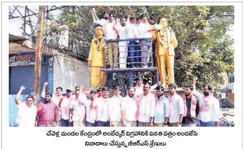
చేపల్లె మండల కేంద్రంలో అంబేద్కర్ విగ్రహానికి వినతి పత్రం అందజేసి నినాదాలు చేస్తున్న బీఆర్ఎస్ శ్రేణులు

I హైదరాబాద్, బుధవారం 18 డిసెంబర్ 2024 RANGAREDDY