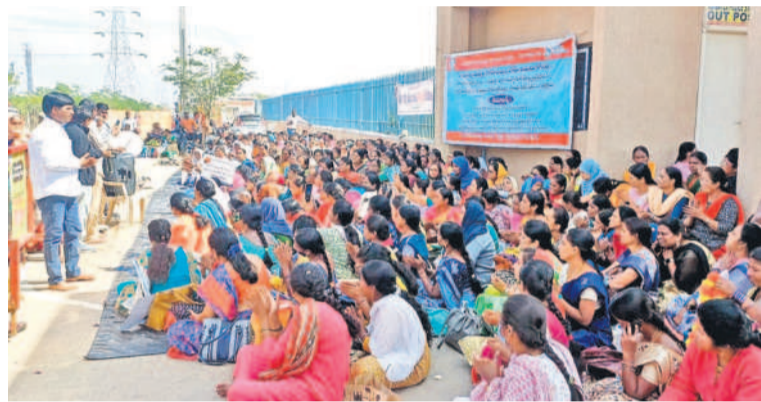
కలెక్టరేట్ ఎదుట ధర్నా చేస్తున్న మధ్యాహ్న భోజన కార్మికులు