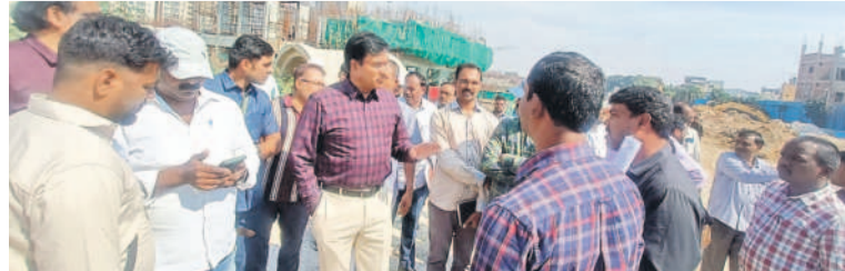
కూకట్‌పల్లిలో కాముని చెరువు, మైసమ్మ చెరువులలో అక్రమాలపై స్థానికులు, అధికారులతో మాట్లాడుతున్న హైద్రా కమిషనర్ రంగనాథ్

చెరువుల అక్రమాలపై కీలక ప్రకటన చేసిన హైద్రా కమిషనర్ రంగనాథ్ కాముని చెరువు, మైసమ్మ చెరువులను పరిశీలించిన హైద్రా బృందం చిన వారిపై చట్టపరమైన చర్యలుంటాయని తెలిపారు. చెరువులు, ఎడీటీఎల్ పరిధిలో నిర్మాణాలు చేపట్టడం తగదని, ఆ నిర్మాణాలను గుర్తించి కూల్చేస్తామన్నారు. హైద్రా ఏర్పాటుకు ముందు నిర్మించిన నిర్మాణాల కోరికే వెళ్లకో మని, వాటిని కూల్చేది లేదని ఆయన స్పష్టం చేశారు. కానీ, ఈ నిబంధన వాణిజ్య సముదాయాలకు వర్తించవచ్చు. చెరువుల నుండరిక రణ పనులను త్వరితగతిన పూర్తి చేయాలని జీపీఎంఎస్ అధికారులను రంగనాథ్ ఆదేశించారు. చెరువుల అక్రమణలు, ప్రభుత్వ స్థలాల అక్రమణలకు పాల్పడిన వారిపై కచ్చితంగా చర్యలు తీసుకుంటామని చెప్పారు. కాముని చెరువులో వెలిసిన రాపాపేంద్ర కాలనీలో పాత ఇండ్లపై చర్యలు ఉండవని, ఇటీవలే కొందరు అనుమతులు లేకుండా నిర్మించిన భవనాలపై చర్యలు ఉంటాయన్నారు. చెరువు కట్టాలపై స్థానికులు అధికారులకు ఫిర్యాదు చేసి, ప్రభుత్వ యంత్రాంగానికి సహకరించాలన్నారు. కాముని చెరువు, మైసమ్మ చెరువు పరిసరాల్లోని నివాసాలు చెరువులు కట్టా కాకుండా చూడాలని స్థానికులను కోరారు.