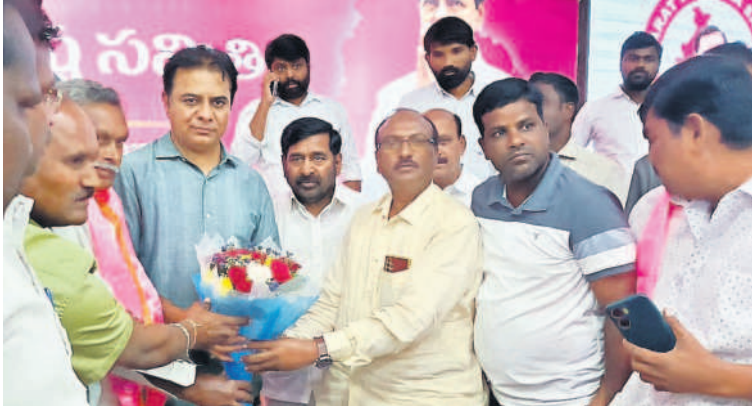
మాజీ మంత్రులు కేటీఆర్, జగదీశ్ రెడ్డిని కలిసిన సూర్యాపేట పారిశుధ్య కార్యకులు