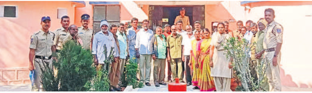
అత్యుక్త (ఎం) : పోలీస్ స్టేషన్ ఆవరణలో నిరసన తెలుపుతున్న గ్రామ వంచాయతీ కార్మికులు

సన్నపడక, మంగళవారం తెల్లవారుజాము నుంచే పోలీసులు ఎక్కడిక్కడ ముందుకు వెళ్తున్నారు. నల్లగొండ జిల్లాలోని శాలిగోరం, త్రిపురారం, పెద్దవూర, మునుపాడ, నార్కట్ పల్లి, తేటిపల్లి, చండూరు ఇలా అనేక గ్రామాల్లోని కార్మికులు మంగళవారం గ్రామ వంచాయతీ కార్మికులకు ముందుకొచ్చారు. పోలీసుల ద్వారా అడ్డుకున్నారు. ఇరు నెలలుగా పెండింగ్లో ఉన్న వేతనాలు, మల్టీపర్సన్ విధానం రద్దు పునరుద్ధారణ మంగళవారం ఉమ్మడికాండ జిల్లా నలుమూలల నుంచి ఆసింట్ కమిషన్కు వెళ్తున్నారని తెలిపారు.