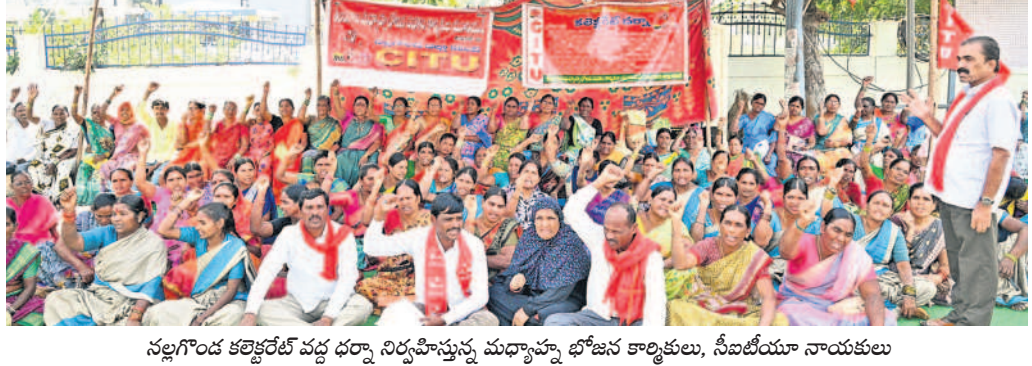
నల్లగొండ కలెక్టరేట్ వద్ద ధర్మా నిర్వహిస్తున్న మధ్యాహ్న భోజన కార్మికులు, సీబీఐ యూ నాయకులు

నల్లగొండ, డిసెంబర్ 17 : సమస్యలు పరిష్కారం కోసం మధ్యాహ్న భోజన కార్మికుల ఆందోళన కొనసాగుతున్నది. 48 గంటల మహాధర్మాత్ భాగంగా రెండో రోజు మంగళవారం కలెక్టరేట్ ఎదుట నిరసన తెలిపారు. సీపీఐ యూ. రాష్ట్ర ఉపాధ్యక్షుడు తుమ్మల వీరాద్రి చోట సమీక్షాసభ తెలిపి మాట్లాడారు. సర్కారు నిర్ణయంతో మధ్యాహ్న భోజన కార్మికులు అర్థాకాలంలో ఆలమట్టిస్తూ న్యూని ఆవేదన వ్యక్తం చేశారు. సకాలంలో భోజనం అందించేందుకు అవసరమైన సదుపాయాలను అందించాలని సూచించింది. కాంగ్రెస్ అధికారంలోకి వచ్చిన దగ్గర నుంచి పల్లెలకు నిధులు లేవని, కార్మికులకు వేతనాలు అప్పుడు లేవని వాపోయారు. అనేక ఇబ్బందుల నడుమ వెళ్లి చాకిరి చేస్తున్న పంచాయతీ కార్మికులకు సకాలంలో వేతనాలు చెల్లించడంతోపాటు ఇతర సౌకర్యాలను కల్పించాలని డిమాండ్ చేశారు. సర్కారు సమస్యలు పరిష్కరించే వరకు తమ ఆందోళన కొనసాగుతున్నదని హెచ్చరించారు.