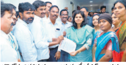
కలెక్టర్ కు వినతిపత్రం అందిస్తున్న టీఎన్టీడీసీ నాయకులు