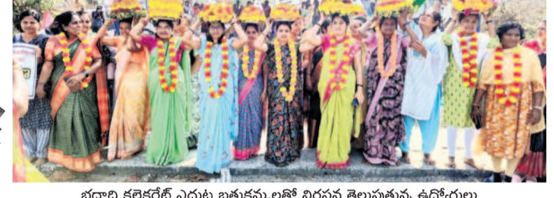
భద్రాద్రి కలెక్టరేట్ ఎదుట బతుకమ్మలతో నిరసన తెలుపుతున్న ఉద్యోగులు

కలెక్టరేట్ వద్ద తొమ్మిదో రోజుకు చేరిన సమ్మె