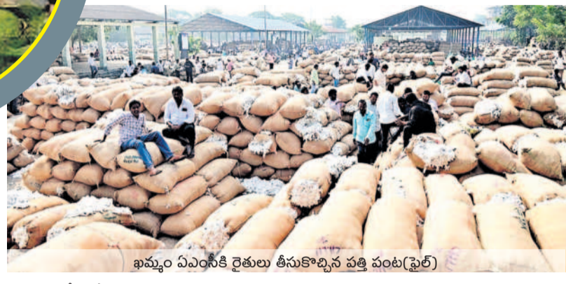
ఖమ్మం ఏఎంసీకి రైతులు తీసుకొచ్చిన పత్తి పంట(ఫైల్)

ఖమ్మం రాజేంద్రం, సాధారణంగా పత్తిలో ఎకరానికి 10-12 క్వింటాళ్ళ దిగుబడి రావాల్సి ఉంటుంది. కానీ.. ఈ ఏడాది 5-6 క్వింటాళ్ళ దిగుబడి మాత్రమే వచ్చిందని రైతులు చెబుతున్నారు. మొదటి దశా పత్తి తరవాత తిరిగి మొగ్గులు రాకపోవడంతో పత్తి పంట స్థానంలో ఆయా మండలాల రైతులు మొక్కజొన్న పంటను సాగు చేశారు.