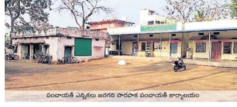
పంచాయతీ ఎన్నికలు జరగని సారపాక పంచాయతీ కార్యాలయం

జిల్లాలోని 22 మండలాలలో ఉన్న గ్రామపంచాయతీలను మాత్రమే గుర్తించారు. ఇందులో భద్రాచలం, సారపాక పంచాయతీ ఓటర్ల జాబితాను సమోదా చేయలేదు. 6,33,947 మంది పల్లె ఓటర్లు గత అసెంబ్లీ ఎన్నికల ఓటర్ల ప్రకారం రూపొందించిన జాబితా ఆధారంగా పంచాయతీ ఓటర్ల జాబితాను అధికారులు సిద్ధం చేశారు. జిల్లాలో కొత్తగా సమోదాైన ఓటర్ల పురుషులు 3,08,492 మంది, మహిళలు 3,25,491 మంది, ఇతరులు 24 మంది ఉన్నారు. మొత్తం పల్లె ఓటర్లు 6,33,947 మంది