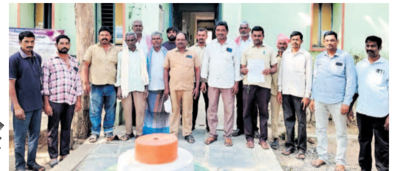
బోనకల్లు ఎంపీడీవో కార్యాలయం ఎదుట ధర్నా చేస్తున్న మల్టీపర్పస్ వర్కర్లు