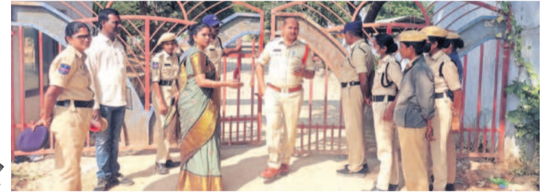
దానవాయిగూడెంలోని బీసీ హాస్టల్ వద్ద మోహరించిన పోలీసులు

తల్లిదండ్రులను, విద్యార్థి సంఘాలను లోపలికి అనుమతించని పోలీసులు