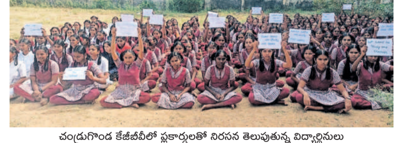
చంద్రగిరి కేజీబీవీ ప్లకార్డులతో నిరసన తెలుపుతున్న విద్యార్థినులు

టీచర్లు రావాలని, చదువు చెప్పాలని డిమాండ్