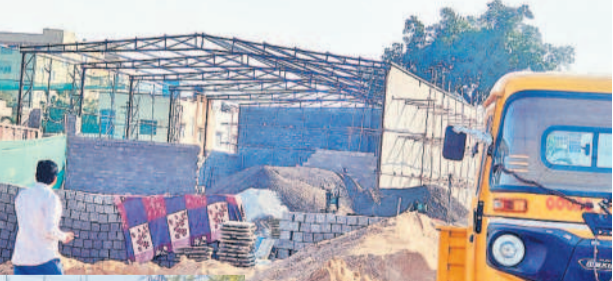
గాజులూరి మారుం విలేజ్ సమీపంలో అనుమతులు లేకుండా వెలుస్తున్న షెడ్యూల్

గాజులూరి మారుం సర్కిల్ పరిధిలో అక్రమ నిర్మాణాలు జోరుగా కొనసాగుతున్నాయి. టౌన్‌షిప్‌నింగ్ అధికారులు, సిబ్బంది తమకేమీ పట్టనట్లు వ్యవహరిస్తుండటంతో అక్రమరంగా రెచ్చిపోతున్నారు. పైగా అక్రమ నిర్మాణాల నియంత్రించడం తమపని కాదంటూ పొర్రపొర్ర అధికారి సెలవియ్యడంతో విచ్ఛలించిపోయాయి అనుమతులు లేని నిర్మాణాలు వెలుస్తున్నాయి.