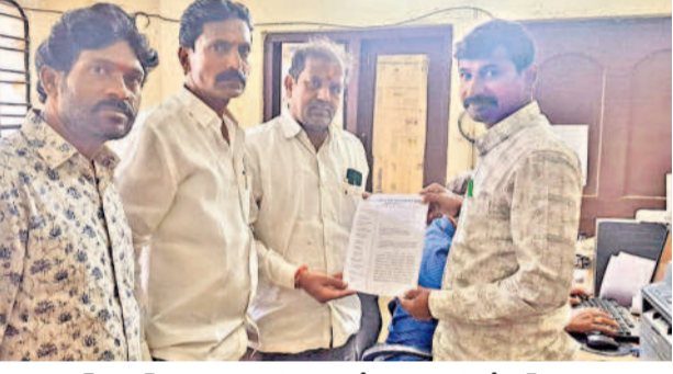
బాలాసగర్ ఎక్స్ప్రెస్ అధికారులకు ఫిర్యాదు చేస్తున్న అసోసియేషన్ సభ్యులు

కేటీహెచ్‌బి కాలనీ, డిసెంబర్ 18: మాసాపేట జనతానగర్లో కొనసాగుతున్న శ్రీ కృష్ణ వైస్‌సైన్స్ స్థానిక ప్రజలు ఇబ్బందులు పడుతున్నారని, నిబంధనల విరుద్ధంగా నిర్వహిస్తున్న వైస్‌సైన్స్ వెంటనే తొలగించేలా చర్యలు తీసుకోవాలని మాసాపేటకు చెందిన సమయి ప్రజలు అందరికీ కోరారు.