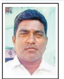
బదాఖీమ్ గౌర్లో సీసీరోడ్డు, సీసీ డ్రైనేజీలు, బోర్ల మరమ్మత్తులు, ఇతర అభివృద్ధి పనులు చేసేందుకు మిత్తల పైసలు తెచ్చి ఖర్చు చేసిన. రూ.38 లక్షల బిల్లులు రావాలే. ఏడాది అయిపోయింది. ప్రభుత్వం నుంచి రూపాయి అప్పజేయలేదు. అప్పు తెచ్చి అభివృద్ధి పనులు చేస్తే చివ్వు చేతికొచ్చేటట్లు ఉన్నది. ఖర్చు పెట్టింది ప్రజల కోసం.

కదా.. బిల్లులు ఇవ్వకుండా ప్రభుత్వం మమ్మల్ని గిట్ట ఇబ్బంది పెట్టుకుంటున్నాం. పెండింగ్ బిల్లులు తెచ్చిస్తారే.