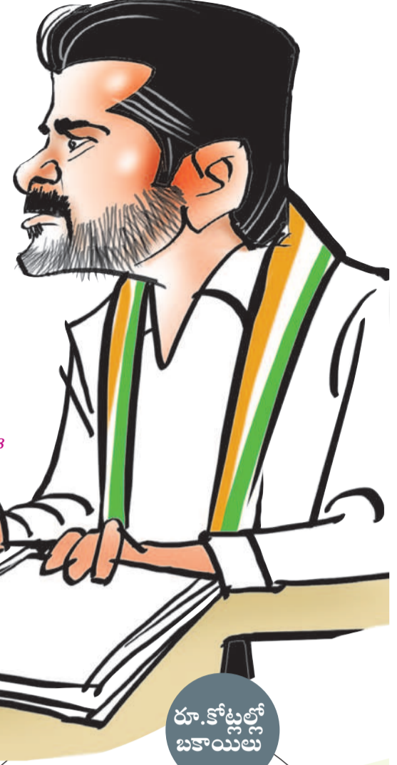
-మోర్లాడ్, డిసెంబర్ 18

కాంగ్రెస్ ప్రభుత్వ నిర్ణయాలపై మాజీ సర్పంచులు సతమతం చేస్తున్నారు. ఏడాది కాలంగా బిల్లులు చెల్లించక పోవడంతో ఆర్థికంగా తీవ్ర ఇబ్బందులు పడుతున్నారు. అప్పులు చేసి గ్రామాల్లో అభివృద్ధి పనులు చేస్తే డబ్బులు ఇవ్వకుండా సర్కారు సతాయిస్తుండడంపై మాజీ ప్రజాప్రతినిధులు అవే ధన చెందుతున్నారు. పెండింగ్ బిల్లులు చెల్లించుకోవడంపై అగ్రహం వ్యక్తం చేస్తున్నారు. సర్కారుపై ఒత్తిడి తెచ్చేందుకు పోరాటానికి సిద్ధమవుతుంటే పోలీసులను పంపి అరిస్తూ చేస్తుండడంపై మండిపడుతున్నారు. ప్రజా పాలన అంటే డబ్బులు ఇవ్వకుండా, నిరసన తెలుపలేకుండా నిర్బంధించడమేనా? అని ప్రశ్నిస్తున్నారు.