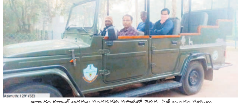
జిల్లా కమిషనర్ అధిపతి సందర్శనకు సఫారీలో వెళ్తున్న ఏజీ బృందం సభ్యులు