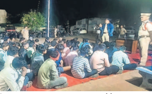
తనిఖీలో పట్టుబడిన వారికి కౌన్సిలింగ్ ఇస్తున్న ఎస్.పీ. ప్రకాష్

● ఎస్.పీ.ఆర్.ప్రకాష్ గోవారిని అదుపులోకి తీసుకుంటున్నామని, మొదటి సారి అయితే కౌన్సిలింగ్ నిర్వహించి పదిలేస్తామని, మూడుసార్లు కంటే ఎక్కువ సార్లు పట్టుబడితే వారిపై కేసులు నమోదు చేస్తామని హెచ్చరించారు. ఈ కార్యక్రమంలో పట్టుబడిన ప్రమాద రావు, మహా పోలీస్ స్టేషన్ సీబి సరేజ్ కుమార్, ఎన్.ఎం. రాములు, సిబ్బంది ఉన్నారు.