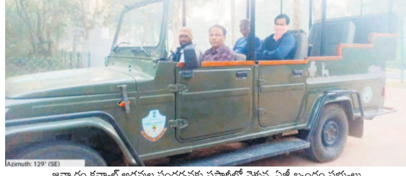
జన్నారం కవ్వాల అడవుల సందర్శనకు సఫారీలో వెళ్తున్న ఏజీ బృందం సభ్యులు