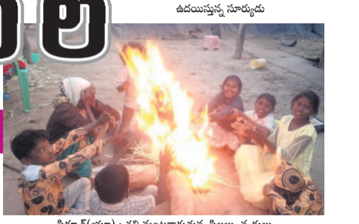
సిర్సూర్(యూ) : చలి మంటకాగుతున్న పిల్లలు, వృద్ధులు