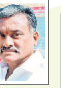
కదా.. బిల్లులు ఇవ్వకుండా ప్రభుత్వం మమ్మల్ని గిట్ట ఇబ్బంది పెట్టుకుంటున్నారని ఆగ్రహం వ్యక్తం చేస్తున్నారు.

కేసీఆర్ హయాంలో పల్లెలకు, ప్రజా ప్రతినిధులకు సముచిత స్థానం దక్కింది. పల్లెప్రగతి పేరుతో బీఆర్ఎస్ ప్రభుత్వం గ్రామాలను అభివృద్ధి బాట పట్టింది. వేలాది కోట్ల రూపాయలతో పచ్చదనం, పరిశుభ్రతకు పెద్దపీట వేసింది. ఊరూరా డ్రైనేజీలు, సీసీ రోడ్లు, వైకుంఠరామాలు, సర్కరీలు ఏర్పాటు చేశారు. రెండు నెలలకోసారి తంపన్ గ్రామపంచాయతీ బిల్లులు చెల్లించారు. అలాగే, పంచాయతీ సిబ్బందికి, పారిశుధ్య కార్మికులకు క్రమం తప్పకుండా వేతనాలు ఇచ్చారు.