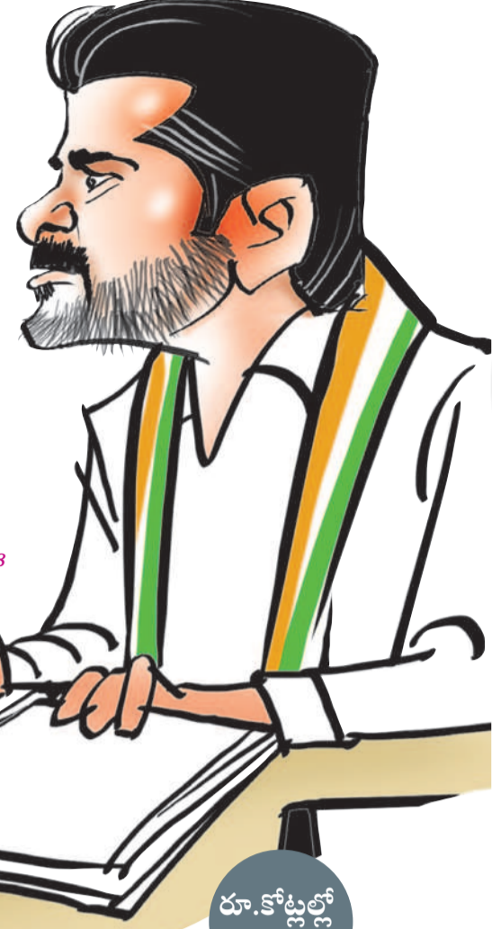
-మోర్లాడ్, డిసెంబర్ 18

కాంగ్రెస్ ప్రభుత్వ నిర్ణయాలపై మాజీ సర్పంచులు సతమతమవుతున్నారు. ఏడాది కాలంగా బిల్లులు చెల్లించక పోవడంతో ఆర్థికంగా తీవ్ర ఇబ్బందులు పడుతున్నారు. అప్పులు చేసి గ్రామాల్లో అభివృద్ధి పనులు చేస్తే డబ్బులు ఇవ్వకుండా సర్కారు సతాయిస్తుందనడంపై మాజీ ప్రజాప్రతినిధులు అవే ధన చెందుతున్నారు. పెండింగ్ బిల్లులు చెల్లించుకోవడంపై అగ్రహం వ్యక్తం చేస్తున్నారు. సర్కారుపై ఒత్తిడి తెచ్చేందుకు పోరాటానికి సిద్ధమవుతుంటే పోలీసులను పంపి అరిస్తూ చేస్తుందనడంపై మండిపడుతున్నారు. ప్రజా పాలన అంటే డబ్బులు ఇవ్వకుండా, నిరసన తెలుపలేకుండా నిర్బంధించడమేనా? అని ప్రశ్నిస్తున్నారు.