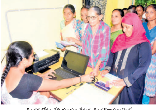
పింఛన్ కోసం వేలీ ముద్దులు వేస్తున్న పింఛనదారులు(ఫైల్)

సూర్యాపేట, డిసెంబర్ 18 (నమస్తే తెలంగాణ) : ఆరు గ్యాంగ్ లో, 420 హామీలతో ప్రజలకు అజ్ఞాపి అధికారంలోకి వచ్చిన కాంగ్రెస్ ప్రభుత్వం గతేడాది కాలంగా మోసం చేస్తూ వస్తున్నది. ప్రధానంగా దేశంలోనే ఎక్కడా లేని విధంగా గత ముఖ్యమంత్రి కేసీఆర్ అపస్వలను ఆడుకునేందుకు కనీవినీ ఎరుగని రీతిని రూ.2వేలకు పింఛన్ పెంచి ఇవ్వగా అంతకు రెట్టింపు చేసి చేయూత పేరిట రూ.4వేలు ఇస్తామని కాంగ్రెస్ సమ్మిచి నట్టిట ముంచుతున్నది. ఏడాది కాలంగా కేసీఆర్ ఇచ్చిన రెండు వేల రూపాయలతోనే సరిపెడుతున్నది. నెలనెలా పింఛన్ తీసుకునేందుకు వెళ్తున్న వ్యక్తులు, వితంతువులు ఈ నెలైనా పింఛన్ పెరిగిందా అంటూ అధికారులను ఆడుగడం పరిపాటిగా మారింది. పింఛన్ పెంచుతామని చెప్పి మోసం చేసిన రేపంతో సర్కార్ ని వ్యర్థులు ఆగ్రహం వ్యక్తం చేస్తున్నారు.