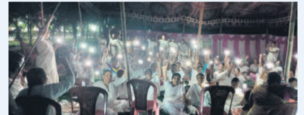
కాంట్రాక్టు పద్ధతిలో ఏళ్లగా పని చేస్తున్న తమకు రాత పరీక్ష నిర్వహించకుండా పరీక్షలు చేయాలని డిమాండ్ చేస్తూ భద్రాద్రి కొత్తగూడెం కలెక్టరేట్ వద్ద గురువారం రాత్రి నిరసన తెలుపుతున్న ఎన్.హెచ్.ఎం. కాంట్రాక్టు, బి.బి. సోల్సింగ్ ఏఎన్.ఎం.

బూర్గంపాడు, డిసెంబర్ 19: ఆన్ లైన్ యాప్స్ ప్రజలు, యువత మోసపోవడం గురించి కొత్తగూడెం సైబెర్ సెల్ సీబి జిఎం.ఎల్ అన్నారు. గురువారం బూర్గంపాడు మండల యువత, ప్రజలకు ఆయన పలు సూచనలు చేశారు. ఇటీవల మండల వ్యాప్తంగా ఆన్ లైన్ పలు యాప్స్ లో మెప్పుబడులు పెడుతూ డబుల్ వస్తుందనే మాటతో పడుతున్నారన్నారు. ప్రస్తుతం ఆన్ లైన్ మోసాలు ఎన్నో జరుగుతున్నాయని, ఆన్ లైన్ యాప్స్ లో డబ్బులు వెల్లడవుతున్నాయి, ఆ యాప్ ల ద్వారా సైబెర్ మోసాలు జరుగుతున్నాయన్నారు. యువత ఆన్ లైన్ మోసాల పట్ల జాగ్రత్తగా ఉండాలన్నారు.