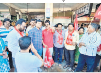
భద్రాచలం సీపీఎం పట్టణ కమిటీ డిశా ఎదురు ఆందోళన చేస్తున్న సీపీఎం నాయకులు