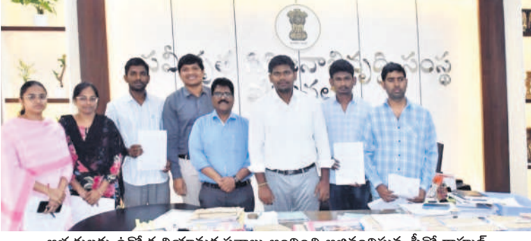
అభ్యర్థులకు ఉద్దేశ్య నియామక పత్రాలు అందించి అభినందిస్తున్న పీవీ రాహుల్