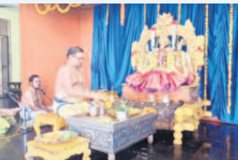
నిత్యకళ్యాణం నిర్వహిస్తున్న అర్చకులు

భద్రాచలం, డిసెంబర్ 19: భద్రాచలం దివ్యక్షేత్రంలోని బేదా మండపంలో అర్చకులు గురువారం స్వామివారికి నిత్యకళ్యాణం నిర్వహించారు. తెల్లవారుజామున ఆలయ తలుపులు తెరిచి స్వామివారికి సుప్రభాతం పలికి ఆరాధన, ఆరంభం, సేవాకాలం, నిత్యహోమాలు, నిత్యబలిహారణ, నిత్యపూజలు జరిపారు. కళ్యాణంలో పాల్గొన్న దాతలను ప్రసాదాలు, శేషమస్తాలు అందజేశారు. కార్యక్రమంలో అర్చకులు, ఆలయ సిబ్బంది పాల్గొన్నారు.