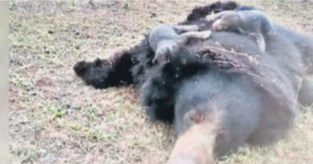
మందుపాతర పేలి మృతించిన ఎలుగుబంటి. ఆకలితో తల్లి ఒడిలో మృతించిన పిల్లలు

వకూడీ పేలి ఎలుగుబంటి మృతి గుర్తించిన ఎలుగుబంటి. ఆకలితో తల్లి ఒడిలో మృతించిన పిల్లలు భద్రాచలం బలగాలుల కర్వణం చేస్తూ