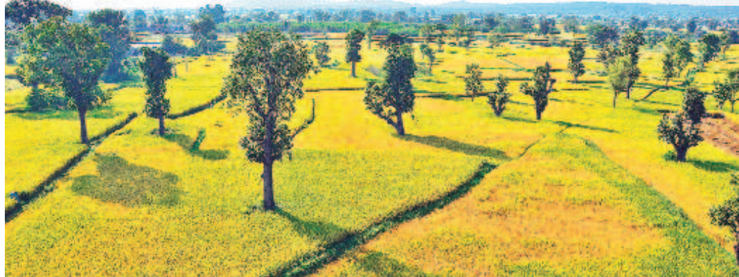
కోటి ఎకరాలకు పెరిగిన సాగు

బీఆర్ఎస్ హయాంలో ప్రాధాన్యత క్రమంలో శరవేగంగా ప్రాజెక్టులు • పెండింగ్ ప్రాజెక్టులన్నీ రన్లో!