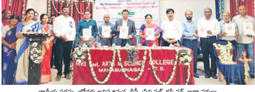
జాతీయ సదస్సు ప్రోవర్షు అవిష్కరిస్తున్న వీసీ, డ్రినిపల్, కన్వీనర్, అధ్యాపకులు