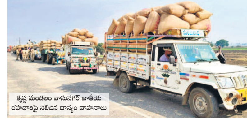
కృష్ణ మండలం వాసునగర్ జాతీయ రహదారిపై నిలిపిన ధాన్యం వాహనాలు

తెలంగాణ అధికారులు, రాజకీయ నాయకులు రైతుల మధ్య నెలకొన్న వ్యతిరేకతను పరిష్కరించేందుకు చొరవ చూపకపోవడంతో రైతులు నిరాశతో వెనుదిరిగారు. రైతుల ఘన ఎవరూ నిలవడంలేదని, తమను పట్టించుకునే నాభుడే లేడంటూ నిరూపించారు. ఇప్పటి నుంచి కర్ణాటకలోకి తెలంగాణ ధాన్యం రావాల్సిన అవసరమే లేదని, ఒకవేళ వస్తే ఎక్కడి వాహనాలు అక్కడి నిలిపివేసిన కర్ణాటక రైతు సంఘాల నాయకులు హెచ్చరిస్తున్నారు.