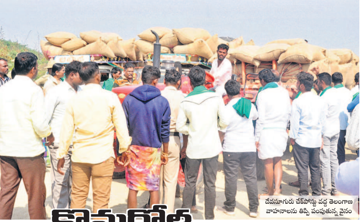
దేవనూగురు చెక్ పోస్టు వద్ద తెలంగాణ వాహనాలను టిప్పి వంపుతున్న వైనం