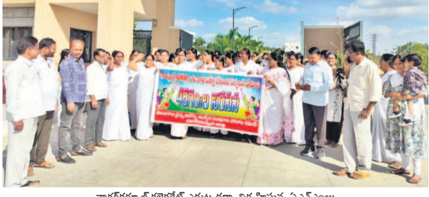
నాగర్ కర్నూల్ కలెక్టరేట్ ఎదుట ధర్మా నిర్వహిస్తున్న ఏఎన్ఎంలు