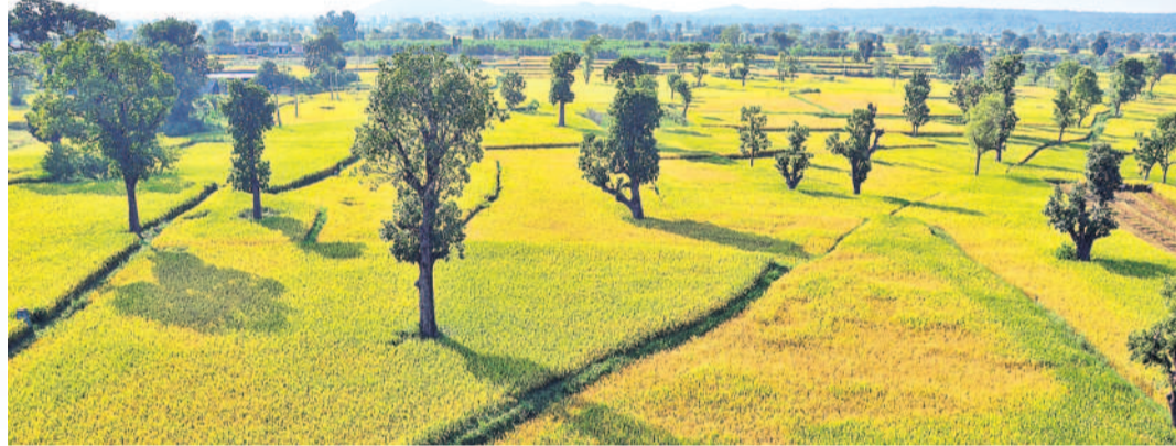
కోటి ఎకరాలకు పెరిగిన సాగు

బీఆర్ఎస్ హయాంలో ప్రాధాన్య క్రమంలో శరవేగంగా ప్రాజెక్టులు • పెండింగ్ ప్రాజెక్టులన్నీ రన్లో!