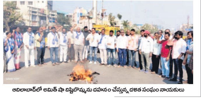
ఆదిలాబాద్ లో అమిత్ షా దిష్టిబొమ్మను దహనం చేస్తున్న దళిత సంఘం నాయకులు

'అమిత్ షా'పై ఆగ్రహం జ్యాల అంబేద్కర్ ను అవమానించినందుకు క్షమాపణ చెప్పాలి దళిత సంఘాల ఆధ్వర్యంలో దిష్టిబొమ్మలు దహనం