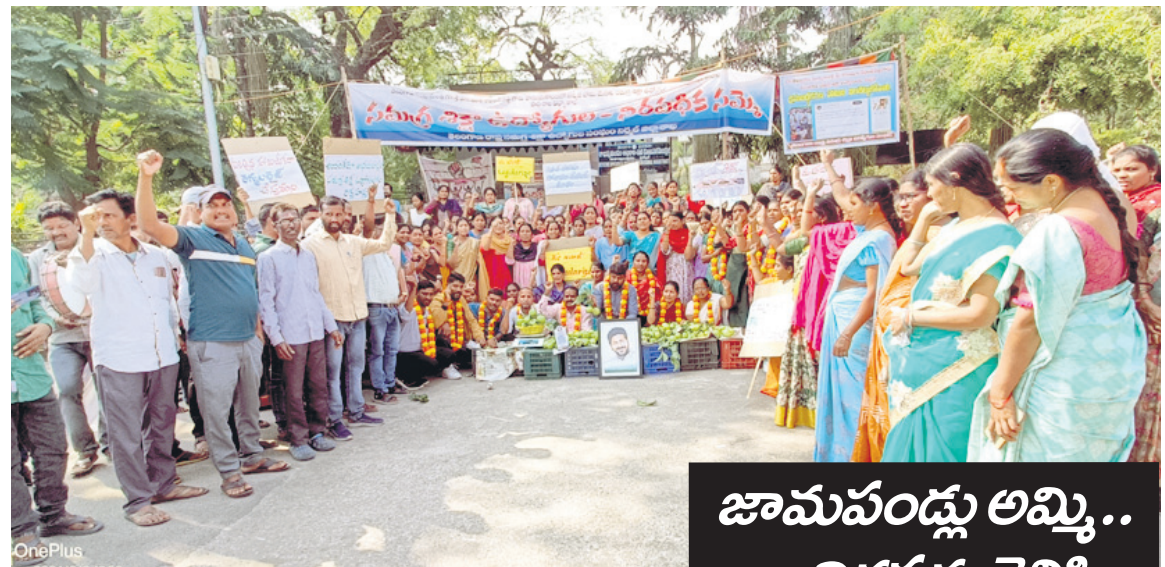
జామపండ్లు అమ్మి నిరసన తెలుపుతున్న ఎన్ఎస్ఐ ఉద్యోగులు

పది రోజులైన స్పందన కరువు జామపండ్లు అమ్మి నిరసన తెలుపుతున్న ఎన్ఎస్ఐ ఉద్యోగులు