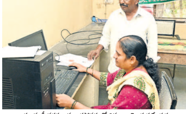
రుణమాఫీ సగదు జమ కాకపోవడంతో వివరాలు తెలుసుకునేందుకు నల్లగొండ జిల్లా కార్యాలయానికి వచ్చిన రైతు

- నల్లగొండ ప్రతినిధి, డిసెంబర్ 19 (నమస్తే తెలంగాణ)