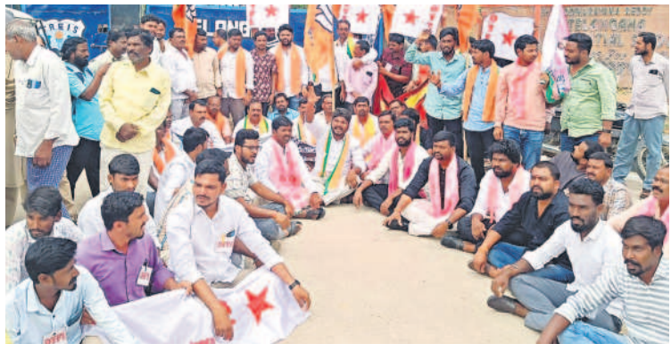
సర్కేల్ గురుకుల పాఠశాల ఎదుట ధర్నా చేస్తున్న విద్యార్థి సంఘాల నాయకులు