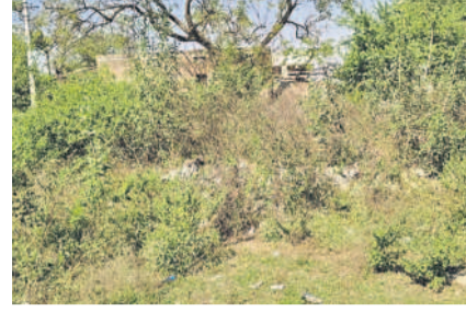
పీహెచ్ఎస్ చుట్టూ పెరిగిన పిల్లిమొక్కలు