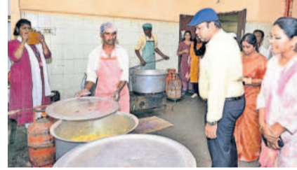
కొల్లూరు: గురుకులంలో వంటలు పరిశీలిస్తున్న కలెక్టర్