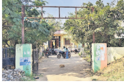
పీహెచ్ఎస్ పేరు లేకుండానే ఉన్న కమాన్ బోర్డు