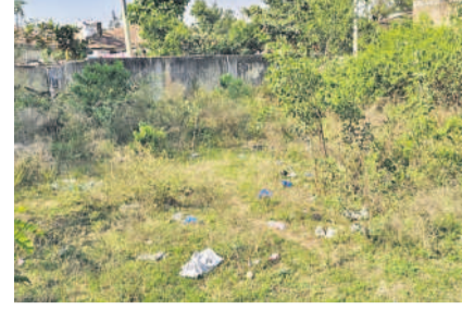
అవలశుభ్రంగా ఉన్న పీహెచ్ఎస్ ప్రాంతం