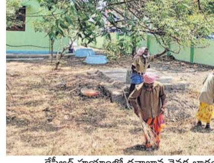
కేసీఆర్ హయాంలో దవాఖాన వెనక భాగంలో శుభ్రం చేస్తున్న పారిశుధ్య కార్మికులు (ఫైర్)

శివ్వంపేట, డిసెంబర్ 19: అవలశుభ్రతకు ప్రాథమిక అంశం కేంద్రం కేరాఫ్ అడ్రెస్ గా మారింది. దవాఖానలో చుట్టూ పిల్లి మొక్కలతో అవలశుభ్రత వాతావరణం కనిపిస్తున్నా సంబంధిత అధికారులు నిమగ్నరెవల్యూషన్ వ్యవహారాన్ని నిర్వహించారు. శివ్వంపేట మండల కేంద్రంలో ఉన్న పీహెచ్ఎస్ లో ఎక్కడ చూసినా పిల్లి మొక్కలు దర్భణమిస్తున్నాయి. ఈ నెల 5న డిపీహెచ్ (డైరెక్టర్ ఆఫ్ పబ్లిక్ హెల్త్) ఆఫీసర్ డాక్టర్ రవీంద్రారావు, డిపీహెచ్ శ్రీరాంలు ప్రభుత్వ దవాఖానను సందర్శించి, దవాఖాన చుట్టూ పరిసరాలను శుభ్రంగా ఉంచుకోవాలని సూచించారు. ఉన్న