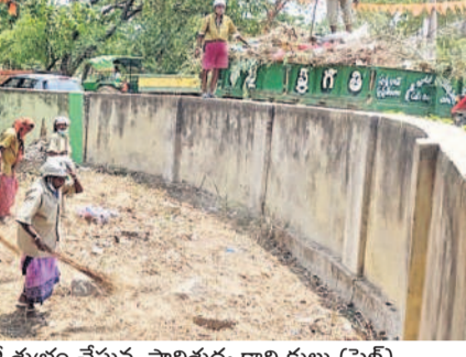
కాలనీ వారు ఏకంగా దవాఖాన ప్రసారంలో చెత్త వేస్తుండడంతో చెత్త దంపంగా మారింది. బీఆర్ఎస్ ప్రభుత్వ హయాంలో చిత్తశుద్ధితో ప్రభుత్వ దవాఖానలో పారిశుధ్యాన్ని పోషించేవారు. చుట్టూ పిల్లిమొక్కలు లేకుండా

తాదికారులు వచ్చి పది రోజులు దాటినా పిల్లి మొక్కలు తొలగించలేదు. దవాఖానలోని మండల స్టార్ రూం ఎడోల ఉపయోగించిన మండలు, సిరంజిలు కాల్చివేసి, ఆ చెత్తను కూడా తొలగించలేదు. దవాఖాన చుట్టూ ఉండే