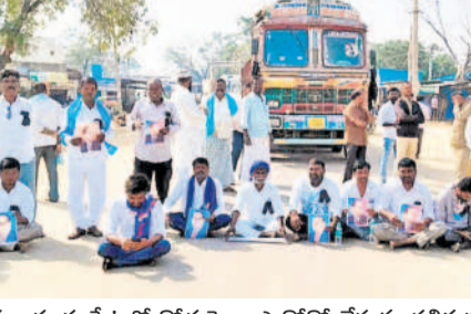
కొల్లూరు: రంగంపేటలో రోడ్డుపై రాస్ట్రాకో కో చేస్తున్న దళిత సంఘాల నాయకులు

రామాయంపేట, డిసెంబర్ 19: పార్లమెంటు సాక్షిగా రాజ్యాంగ నిర్మాత అంబేద్కర్ ను అవమానించడం బీజేపీకి చెందిన, కేంద్ర రోజులాగా పాఠశాల నుంచి అంటికి వెళ్తున్న క్రమంలో రోడ్డు దాటుతున్నాడు. నర్సాపూర్ నుంచి వెల్లూరి వైపు వస్తున్న మారుతి కారులో కారు వేగంగా వచ్చి విద్యార్థిని డ్రీకాని నుంచి వెల్లూరి వైపు వస్తున్న మారుతి కారులో కారు వేగంగా వచ్చి విద్యార్థిని డ్రీకాని నుంచి వెల్లూరి వైపు వస్తున్న మారుతి కారులో కారు వేగంగా వచ్చి విద్యార్థిని డ్రీకాని నుంచి వెల్లూరి వైపు వస్తున్న మారుతి కారులో