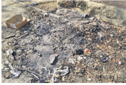
స్టార్ రూం దగ్గర కాల్చిన మండలు, సిరంజిలు