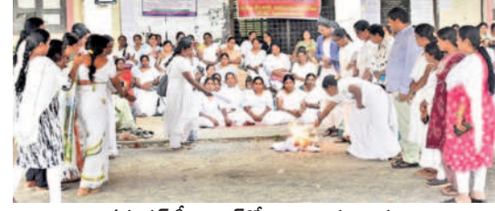
వరంగల్ డిఎంహెచ్ఎం కార్యాలయం ఎదుట హాల్ టికెట్లను దహనం చేస్తున్న ఏఎన్ఎంలు