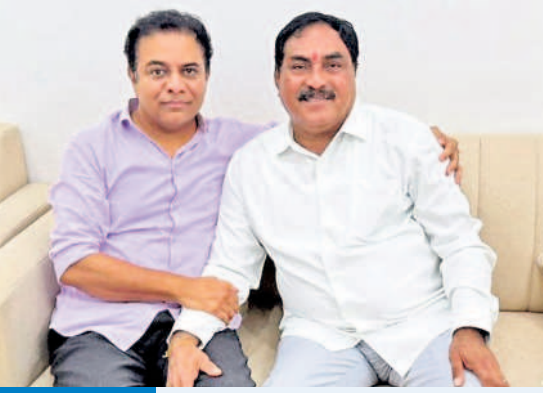
బీఆర్ఎస్ వర్కర్ల పైసిడెంట్ కేటీఆర్ ను శుక్రవారం మాజీ మంత్రి ఎర్రబెల్లి దయాకర్ రావు మర్యాదపూర్వకంగా కలిశారు. కేటీఆర్ పై కాంగ్రెస్ ప్రభుత్వం అక్రమంగా ఏసీబీ కేసు నమోదు చేసిన సందర్భంగా ఆయనను హైదరాబాద్ లో కలిసిన పలు విషయాలు లిప్తించారు.