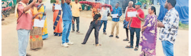
వాణిజ్య : అమిత్ షా దిద్దివేళ్లు దహనం చేస్తున్న అదివాసీ గిరిజన సంఘం సభ్యులు