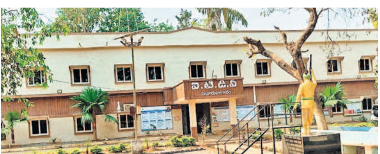
పటూరు నాగారంలోని ఐటీడీఎం కార్యాలయం

ఐటీడీఎం పాలకమండలి సమావేశం నిర్వహణపై అధికార యంత్రాంగం తీవ్ర నిర్లక్ష్యం కనబరుస్తున్నది. వ్యాపారానికి ప్రతి మూడు నెలల కోసాని నిర్వహించాల్సి ఉండగా ఐదేండ్లు దాటితూ దాని ఊసే ఎక్కడం లేదు. సమస్యలు, సంక్షేమ పథకాలపై చర్చ జరిగితే నిధులు కేటాయించే అవకాశం ఎక్కువగా ఉంటుంది. కానీ 2019 డిసెంబర్ 20న నిర్వహించిన 60వ పాలక మండలి సమావేశం చివరిదిగా మిగిలిపోయింది. దీంతో గిరిజన సంక్షేమపై నీటిరీడలు కమిషన్లు అభివృద్ధి ముందుకు సాగడం లేదు. సబ్సిడీ పథకాలు అర్జులకు అందకుండా వెళ్లి రిస్తున్నాయి. ఇప్పటికైనా ఐటీడీఎం పాలకమండలి సమావేశం నిర్వహించి తమ సమస్యలు పరిష్కరించాలని అడవి బిడ్డలు కోరుతున్నారు.