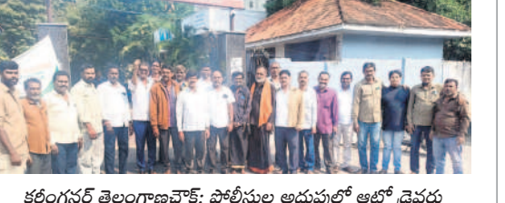
కరీంనగర్ తెలంగాణచెట్లో పోలీసుల ఆడుపులో ఆటో డ్రైవర్లు

వేములవాడ/కరీంనగర్ కార్పొరేషన్/వెట్స్ పల్లి/కరీంనగర్ తెలంగాణ చెట్లో/కేటీఆర్, డిసెంబర్ 20: సమస్యల పరిష్కారం కోసం చలో అసెంబ్లీ బీకె బయలుదేరిన ఆటో డ్రైవర్లు, డ్రైవర్లు శుభవార్త ఏదైనా అని మండిపడ్డారు. ఇల్లంతకుండు శుభవార్త ఏదైనా అని మండిపడ్డారు. ఇల్లంతకుండు శుభవార్త ఏదైనా అని మండిపడ్డారు. ఇల్లంతకుండు శుభవార్త ఏదైనా అని మండిపడ్డారు. ఇల్లంతకుండు శుభవార్త ఏదైనా అని మండిపడ్డారు.