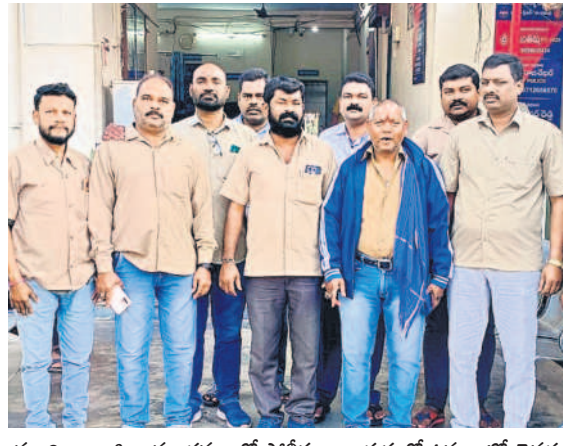
మంచిర్యాల జిల్లా మండలంలో పోలీసులు అదుపులో ఉన్న ఆటో డ్రైవర్లు