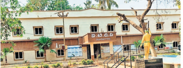
పటూరు నాగార్ లోని ఐటీడీఎం కార్యాలయం

ఐటీడీఎం పాలకమండలి సమావేశం నిర్వహణపై అధికార యంత్రాంగం తీవ్ర నిర్లక్ష్యం కనబరుస్తున్నది. వ్యావహారిక ప్రతి మూడు నెలల కోసాని నిర్వహించాల్సి ఉండగా ఐదేండ్లు దాటితూ దాని ఊసే ఎక్కడం లేదు. సమస్యలు, సంక్షేమ పథకాలపై చర్చ జరిగితే నిధులు కేటాయించే అవకాశం ఎక్కువగా ఉంటుంది. కానీ 2019 డిసెంబర్ 20న నిర్వహించిన 60వ పాలక మండలి సమావేశం చివరిదిగా మిగిలిపోయింది. దీంతో గిరిజన సంక్షేమపై నీరీడలు కమృతమయ్యాయి. అభివృద్ధి ముందుకు సాగడం లేదు. సబ్సిడీ పథకాలు అర్జులకు అందకుండా వెళ్లి రిస్తున్నాయి. ఇప్పటికైనా ఐటీడీఎం పాలకమండలి సమావేశం నిర్వహించి తమ సమస్యలు పరిష్కరించాలని అడవి బిడ్డలు కోరుతున్నారు.