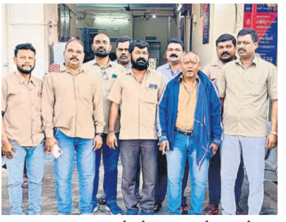
మంచిర్యాల జిల్లా మండలంలో పోలీసులు అదుపులో ఉన్న ఆటో డ్రైవర్లు