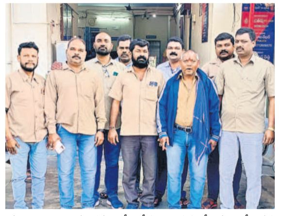
మంచిర్యాల జిల్లా మండలంలో పోలీసులు అదుపులో ఉన్న ఆటో డ్రైవర్లు