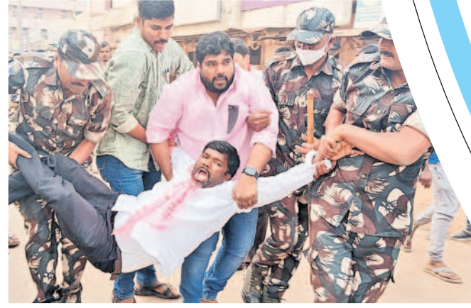
జీఆర్ఎస్ పార్టీ నాయకులను అరెస్టు చేస్తున్న పోలీసులు