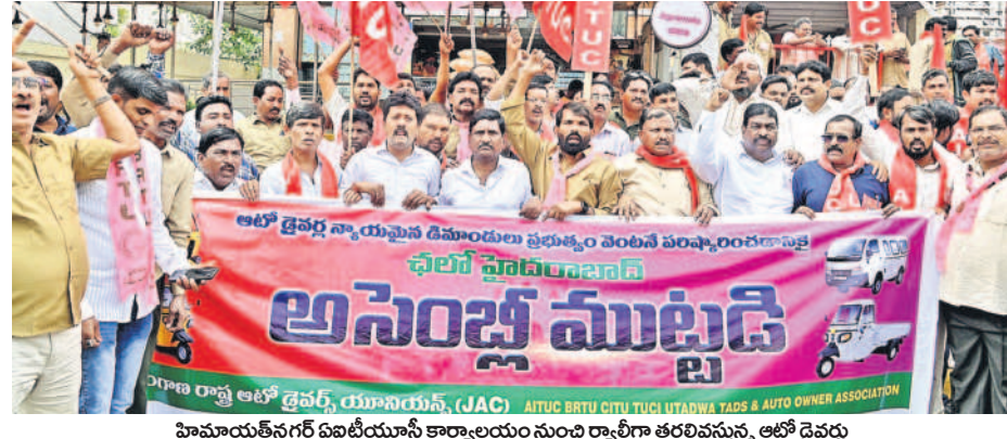
హిమాయత్ నగర్ ఏసీబీ యూనిట్ కార్యాలయం నుంచి ర్యాలీగా తరలివస్తున్న ఆటో డ్రైవర్లు

అసెంబ్లీని ముట్టడించే యత్నం చేసిన ఆటో డ్రైవర్లు