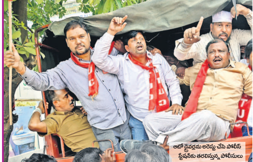
ఆటో డ్రైవర్లను అరెస్టు చేసే పోలీస్ స్పెషల్స్ తరలివస్తున్న పోలీసులు