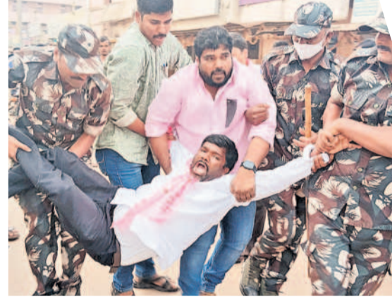
జీఆర్ఎస్ పార్టీ నాయకులను అరెస్టు చేస్తున్న పోలీసులు