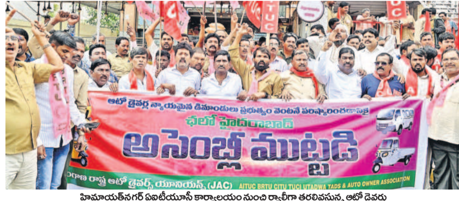
హిమాయత్ నగర్ నివాసిని కాల్వలోకి నుంచి రక్షించుకున్న ఆటో డ్రైవర్లు

అడుకుంటామన్నారు.. గెలిచాక మొండి చేయి చూపారు ... ఆటో డ్రైవర్లను మోసం చేసిన రేవంత్ రెడ్డి ప్రభుత్వం