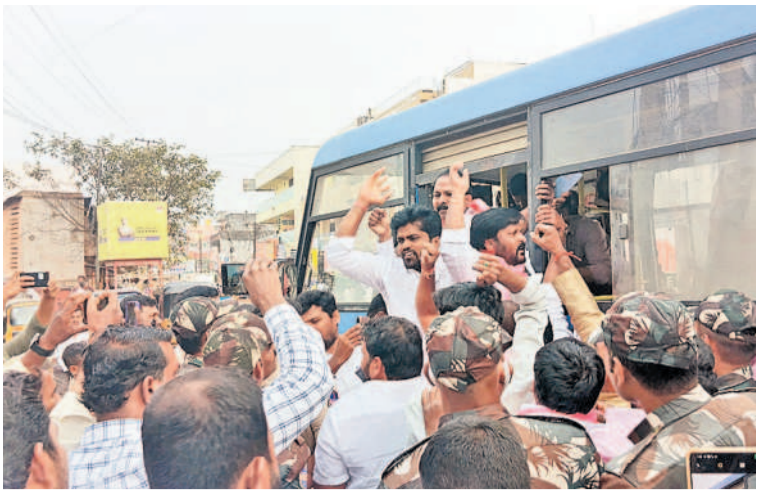
జీఆర్ఎస్ పార్టీ నాయకులను వ్యాన్లోకి ఎక్కించి పోలీసు స్టేషన్కు తీసుకెళ్తున్న పోలీసులు