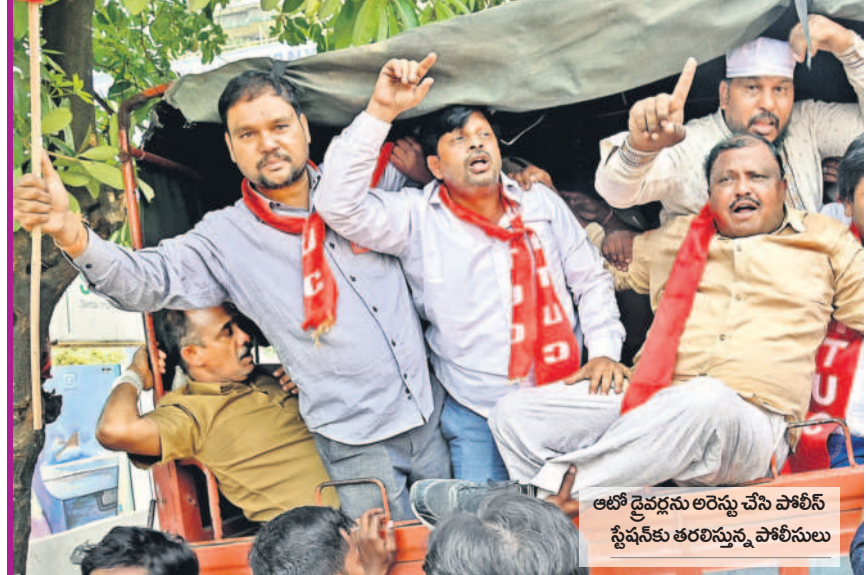
ఆటో డ్రైవర్లను అరెస్టు చేసే పోలీస్ స్టేషన్కు తరలివస్తున్న పోలీసులు