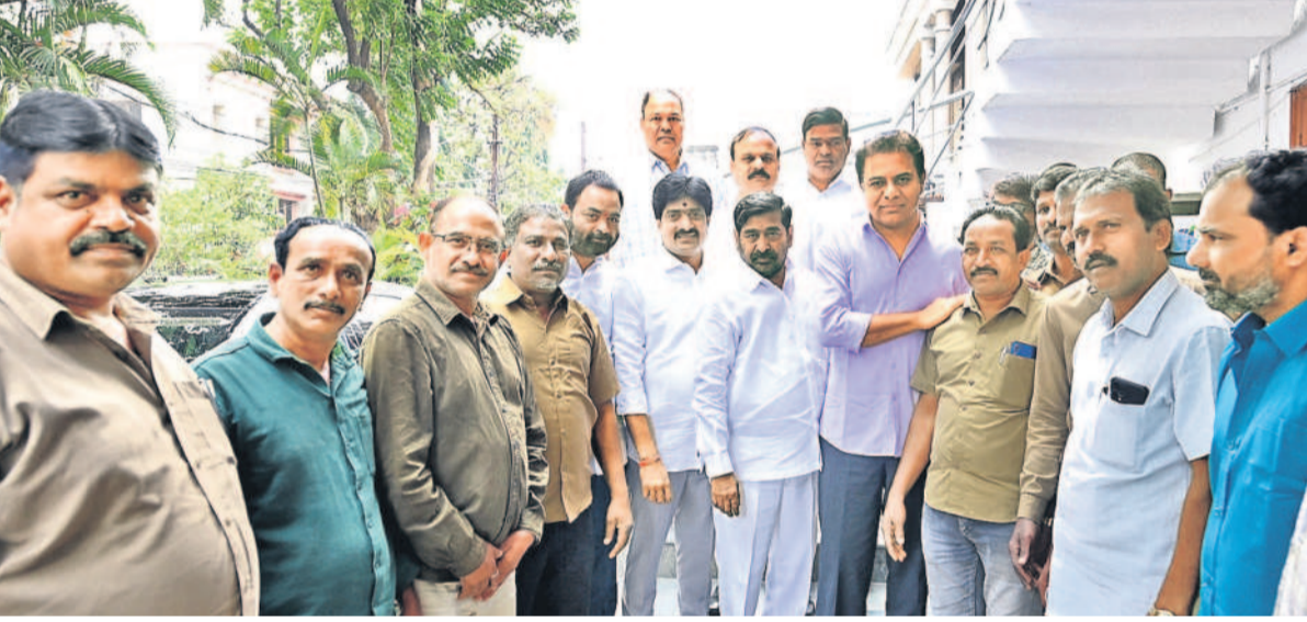
ఆలంపూర్ చౌరస్తా, డిసెంబర్ 20 : హైదరాబాద్ లో బీఆర్ఎస్ వర్కింగ్ ప్రెసిడెంట్ కేటీఆర్ ను ఆటో వారు మర్యాదపూర్వకంగా కలిశారు. శుక్రవారం ఆలంపూర్ ఎమ్మెల్యే విజయమతో కలిసి తమ వజ్రాన కాంగ్రెస్ ప్రభుత్వంతో కొట్లాడుతున్నందుకు ఆటో డ్రైవర్ల కృతజ్ఞతలు తెలిపారు. ఇప్పటికే 100 మందికిపైగా ఆటో డ్రైవర్ల ఆత్మహత్యలు చేసుకున్నారు, ఇకపై ఎవరూ అలాంటి పనులు చేయద్దని భరోసానిచ్చారు. మీ సమస్యలపై పోరాటం చేసేందుకు సిద్ధంగా ఉన్నామని కేటీఆర్ హామీ ఇచ్చారు.

నమస్తే నెట్వర్క్ డిసెంబర్ 20 : సమస్యల పరిష్కారం కోసం చలో అసెంబ్లీ బయలుదేరి ఆటో యజమానులు, డ్రైవర్లను శుక్రవారం పోలీసులు అరెస్ట్ చేశారు. ఉమ్మడి కరీంనగర్ జిల్లా వ్యాప్తంగా హైదరాబాద్ కు వెళ్తున్న ఆటో కార్మికులను ముందస్తుగా అదుపులోకి తీసుకుని రాజాకు తరలించారు.