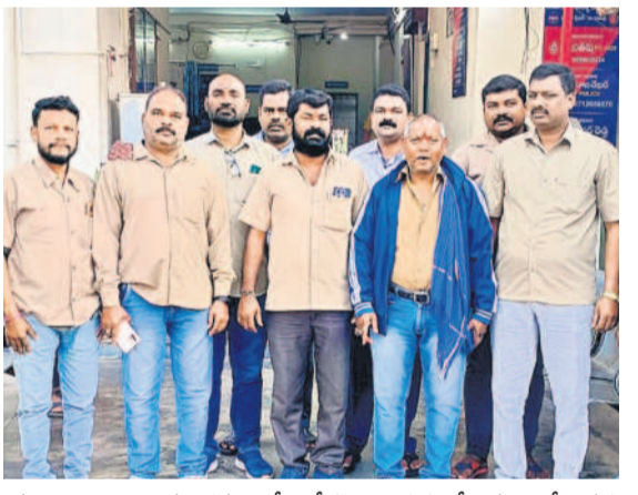
మంచిర్యాల జిల్లా మండలంలో పోలీసులు అదుపులో ఉన్న ఆటో డ్రైవర్ల