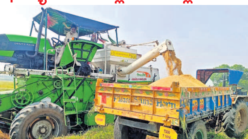
జిల్లాలోని నికర్షిగా నీటి వాటా అందిస్తూ రెండు పంటలకు సాగునీరు అందించారు. కృష్ణా జలాలకు కొద్దికాలంలోనే కాశీశృంగం ప్రాజెక్టు ద్వారా గోదావరి జలాలతోడయ్యాయి. మిషన్ కాకతీయలో చిన్న నీటి వనరులను పటిష్టపర్చడంతో భూగర్భజలాల సమృద్ధిగా అందుబాటులోకి వచ్చాయి. వీటన్నింటికీ తోడు 2018 నుంచి వ్యవసాయానికి 24 గంటల కరెంటు సరఫరా అతిపెద్ద మార్పునుకు బాటలు వేసింది. సాగు బడిలో రైతుకు ధైర్యమిస్తూ రైతుబంధు తోడైంది. ఇవన్నీ వెలసిన నల్లగొండ రైతుల స్థితిగతులనే మార్చేసాయి. ముఖ్యంగా వరి సాగులో నల్లగొండ రైతులు దేశం దృష్టిని ఆకర్షించే స్థాయికి చేరారు. దేశంలోనే అతి ఎక్కువ వరి పండిస్తున్న జిల్లాగా నల్లగొండ అగ్రగణ్యంగా నిలిచింది. 13.54లక్షల ఎకరాలకు వరి సాగు విస్తీర్ణం పెరిగి 34 లక్షల మెట్రిక్ టన్నుల ధాన్యం పండింది రాష్ట్రానికి తలసరానికా ఉమ్మడి నల్లగొండ జిల్లా నిలిచింది.