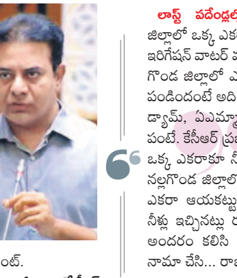
-మాజీ మంత్రి కేటీఆర్

వ్యవసాయ స్థిరీకరణలో భాగంగా రైతు బంధు పెట్టాం. 24 గంటల నాణ్యమైన నిరంతరం ఉచిత విద్యుత్ ఇచ్చాం. ప్రతి నీటి బిల్లుకు ఒకటిపాళ్ల నీళ్లు ఇవ్వాలన్న విజిండాతో పని చేశాం. అందుకే కేసీఆర్ ప్రభుత్వ హయాంలో నల్లగొండ జిల్లా ధాన్యం ఉత్పత్తిలో దేశంలోనే నెంబర్ వన్ గా నిలిచింది. పదేండ్లలో రైతుకు మూత్రమే కాదు.. సకాలంలో ఎరువులు, విత్తనాలు, రైతు వేదికలు సమకూర్చాం. వ్యవసాయ స్థిరీకరణ జరుగుతున్న లక్ష్యంతో పని చేశాం. వ్యవసాయ మోటార్లకు మీటర్ పెట్టకుండా 30 వేల కోట్లను పడుతుకున్నాం. ఇది మా కేసీఆర్ కమిట్మెంట్.