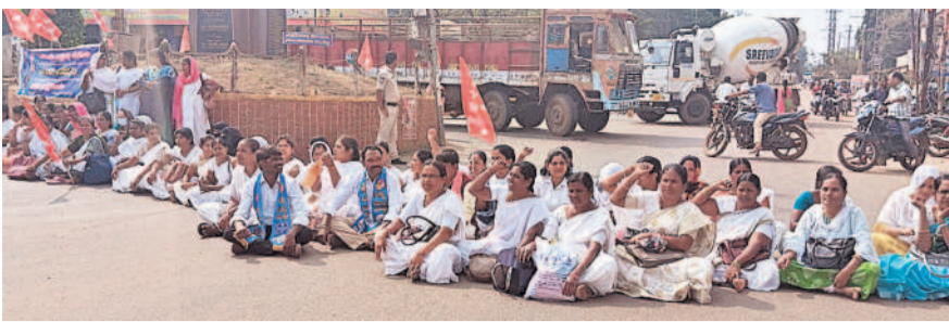
వికారాబాద్ చౌరస్తాలో ధర్మా చేస్తున్న ఏఎన్ఎల

జిల్లా వైద్యారాజులకి వివేక పత్రాన్ని అందజేస్తున్న ఏఎన్ఎల (ఫైల్) క్షుడు తీసుకువచ్చి వీరి సమ్మెకు మద్దతు తెలిపారు. 22 ఏండ్ల నుంచి గ్రామాల్లో పీహెచ్ఎస్, ప్రభుత్వ డాక్టర్లుగా రాత్రిం బువల్ విధులు నిర్వహిస్తున్నా. చాలావరకు జీవితాల్లో జీవితాలు వెళ్ళిపోయాయి. కుటుంబాలను పోషిస్తున్నామని ఆవేదన వ్యక్తం చేస్తున్నారు. అందరికీ రిటైర్మెంట్ బెనీఫిట్స్, పెన్షన్ సౌకర్యం కల్పించాలని కోరారు. కాంట్రాక్టు ఏఎన్ఎలందరికీ ప్రభుత్వ ఉద్యోగులుగా గుర్తించాలి. ఈ నెల 29న నిర్వహించే రాత పరీక్షలు వెంటనే రద్దు చేయాలని డిమాండ్ చేస్తున్నారు. రాష్ట్ర వ్యాప్తంగా పిలుపులో భాగంగా వికారాబాద్ జిల్లా కేంద్రంలో నిరసన డిక్షలు చేశారు. శనివారం జిల్లా కేంద్రంలోని ఎన్టీఆర్ చౌరస్తాలో చేపట్టిన నిరసనలు, ధర్మాలు చేశారు. వీరి ధాదాపుగా గంటకు పైగా రోడ్డుపై ధర్మా చేయడంతో రాకపోకలకు తీవ్ర ఇబ్బందులు ఏర్పడ్డాయి. పోలీసులు జోరంతో చేపడుతున్న ధర్మాలు వీరమించలేదు. చాలా సేపటి తర్వాత ఏఎన్ఎల శాంతించి ధర్మాలు విరమించారు. రాష్ట్ర ప్రభుత్వం స్పందించి న్యాయమైన సమస్యలను పరిష్కరించాలని, లేనివకంలో అందరినీ తీవ్రతరం చేస్తామని హెచ్చరిస్తున్నారు.