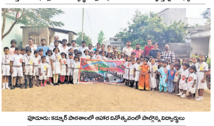
ఫూడూరు : కడపలో పాఠశాలలో ఆహార దినోత్సవంలో పాల్గొన్న విద్యార్థులు

ప్రాథమిక పాఠశాలలో ఆహార దినోత్సవం నిర్వహించారు. ఈ సందర్భంగా ఆయన పౌష్టికాహారం అందక రోగాల బారిన పడుతున్నారని హెచ్చించి మద్దతు పేర్కొన్నారు. శనివారం పూడూరు మండల పరిషత్ కడపలో