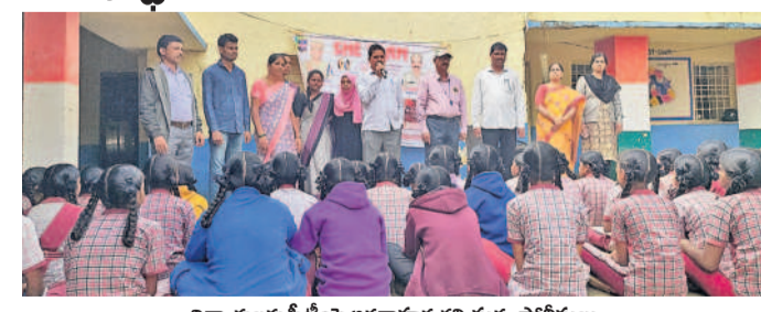
విద్యార్థులకు షీటీంపై అవగాహన కల్పిస్తున్న పోలీసులు