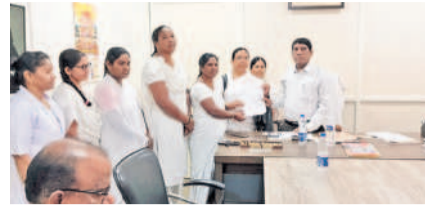
వికారాబాద్ చౌరస్తాలో ధర్మా చేస్తున్న ఏఎన్ఎల

వికారాబాద్, డిసెంబర్ 21 : వారంతా కాంట్రాక్టు ఏఎన్ఎలకు, 22 ఏండ్ల నుంచి పని చేస్తున్నారు. ప్రభుత్వ పదకాలు, ప్రజలకు మెరుగైన సేవలు అందించడంలో వారు కీలక పాత్ర పోషిస్తున్నారు. 2006లో కాంగ్రెస్ ప్రభుత్వ హయాంలో మొదటి విడుదలకు ఉన్న ఏఎన్ఎలను రెగ్యులర్లైజేషన్ చేసింది. అప్పటి నుంచి ఇప్పటి వరకు ఏఎన్ఎలను కాంట్రాక్టు పద్ధతిని పని చేస్తున్నారు. ఒక్కో ఏఎన్ఎం దాదాపు 10 నుంచి 22 ఏండ్లుగా వైద్య శాఖలో పనులు చేస్తున్నారు. వారికి రూ.27వేల వేతనం అందిస్తున్నారు. డిసెంబర్ 29న ఏఎన్ఎలకు రాత పరీక్షలు నిర్వహించేందుకు ప్రభుత్వం సిద్ధమైంది. ఈ రాత పరీక్షల్లో ఉత్తీర్ణులైన వారిని రెగ్యులర్లైజేషన్ చేస్తామనడం సరికాదు. జిల్లాలో ఉన్న 180 మంది ఉద్యోగులను పర్మినెంట్ చేయాలని డిమాండ్ చేస్తున్నారు. పెరిగిన ధరలకు అనుగుణంగా వేతనాలు పెంచాలని, ప్రభుత్వ ఉద్యోగులుగా గుర్తించాలని సమ్మెకు దిగారు. రాత పరీక్షలు వెంటనే రద్దు చేసి, అందరినీ ప్రభుత్వ ఉద్యోగులుగా గుర్తించాలని మిడికల్ అండ్ ఎంపా యని యూనియన్ ధర్మాలు చేపడుతున్నారు.