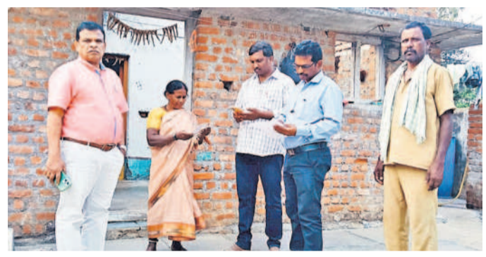
దోమలో ఇందిరమ్మ ఇండ్ల సర్వేను పరిశీలిస్తున్న అధికారులు