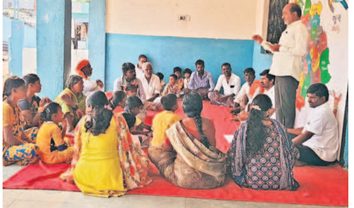
దొల్తూరు : గోఖల్ వాడలో విద్యార్థుల తల్లిదండ్రులకు అవగాహన కల్పిస్తున్న ఉపాధ్యాయులు