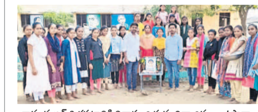
రామానుజన్ విత్తవలూనికి నివాళులర్పిస్తున్న విద్యార్థులు, ఉపాధ్యాయులు

ఇంద్రవెల్లి, డిసెంబర్ 22 : మండలంలోని గిరిజన బాలిక ఆశ్రమ పాఠశాలలో విద్యార్థులతోపాటు ఉపాధ్యాయుల అధ్యక్షులతో ప్రముఖ గణిత శాస్త్రవేత్త శ్రీనివాస రామానుజన్ జయంతి నిర్వహించారు. ఆదివారం పాఠశాల ఆవరణలో గణిత శాస్త్రవేత్త శ్రీనివాస రామానుజన్ విత్తవలూ వద్ద ఉపాధ్యాయులు, విద్యార్థులు నివాళులర్పించారు.