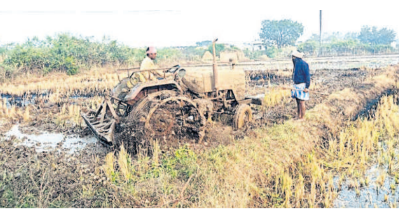
దస్తూరాబాద్ : ట్రాక్టర్ తో జంబు కొట్టిస్తున్న రైతు

ఖానాపూర్, డిసెంబర్ 22 : ఖానాపూర్ మున్సిపాలిటీ సంఘం అధ్యక్షులలో మండల ఉత్తమ రైతులను నేడు సన్మానించనున్నట్లు సంఘం అధ్యక్షుడు కడుకుంట్ల రవీందర్ ఆదివారం ఒక ప్రకటనలో తెలిపారు. అర్హతైన రైతులతోపాటు ప్రజలు, రైతు సంఘాల నాయకులు పట్టణంలోని రైతు నాగి విగ్రహం వద్దకు ఉదయం 11 గంటల వరకు రావాలని కోరారు.