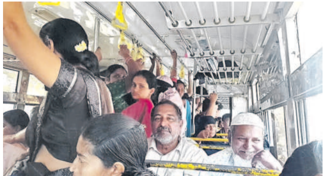
నిర్వహణ - మంచిర్యాల ఆర్టీసీ బస్సులో పరిమితికి మించి ప్రయాణిస్తున్న జనం

ఖానాపూర్, డిసెంబర్ 22 : ఉచిత బస్సు సౌకర్యంతో మహిళలు, ఉద్యోగస్తులు, విద్యార్థులు అప్రకుల గురవుతున్నామని తీవ్ర ఆవేదన వ్యక్తం చేస్తున్నారు. అధికారం నిర్వహణ-మంచిర్యాల ఆర్టీసీ బస్సులో ఖానాపూర్ రావడానికి వందల మంది ప్రయాణికులతో కిక్కిరిసిపోయింది. తమ గమ్యస్థానానికి వెళ్లాలంటే బస్సులు సరిపోవడంలేదని ఆరోపించారు. ఉన్న బస్సులో సామర్థ్యానికి మించి జనాన్ని ఎక్కించడంతో ఎక్కడ ప్రమాదం చోటుచేసుకుంటుందో భయంతో