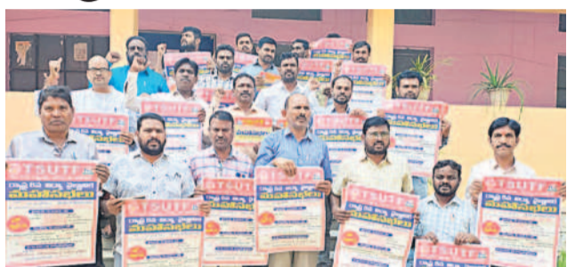
మహాసభలకు సంబంధించిన కరతప్రకాశను ఆవిష్కరిస్తున్న సభ్యులు