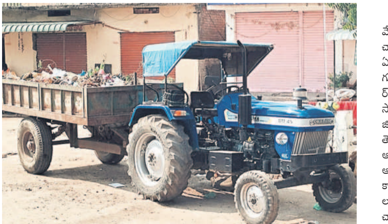
కుభీర్: కుభీర్లోని పాత బస్టాండులో చెత్తకోడీ ట్రాక్టర్

కుభీర్, డిసెంబర్ 22 : మండలంలోని అన్ని జిల్లాలలో డిజిల్లెట్ల డబ్బులు లేక గ్రామంలో చెత్తను సేకరించడం నామమాత్రంగా తయారైంది. ఇంటింటికి తిరిగి చెత్తను సేకరించిన రోజులు గడిచిపోయాయి. యేడాది క్రితం పగ్గాలు చేపట్టిన కాంగ్రెస్ ప్రభుత్వం జీవలకు నిధులివ్వకపోవడం, సర్పంచుల పదవీ కాలం ముగియడంతో పాలన జీవనంలోపాటు ప్రత్యేకాధికారులు లేక చేతుల్లోకి వెళ్లింది. ఏడాది నుంచి అప్పులు త్రంగా తయారైంది. ఇంటింటికి తిరిగి చెత్తను సేకరించిన రోజులు గడిచిపోయాయి. యేడాది క్రితం పగ్గాలు చేపట్టిన కాంగ్రెస్ ప్రభుత్వం జీవలకు నిధులివ్వకపోవడం, సర్పంచుల పదవీ కాలం ముగియడంతో పాలన జీవనంలోపాటు ప్రత్యేకాధికారులు లేక చేతుల్లోకి వెళ్లింది. ఏడాది నుంచి అప్పులు త్రంగా తయారైంది. ఇంటింటికి తిరిగి చెత్తను సేకరించిన రోజులు గడిచిపోయాయి.