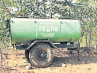
ప్రకృతి వనంలో వృధాగా పడి ఉన్న నీటి ట్యాంకర్

వనంలోనే నీటి ట్యాంకర్ వృధాగా పడి ఉంది. మొక్కలు ఎండిపోతున్నా నీళ్లను పట్టకపోవడంపై వాళ్ల పనితీరు విమర్శించాడంటే అని ప్రజలు ప్రశ్నిస్తున్నారు. ఉన్నాధికారుల పర్యవేక్షణ లేవడంతో ఇలాంటి వాటిని చూసేమాడనట్లు పదిలేస్తున్నారని అని ప్రజలు చర్చిస్తున్నారు.