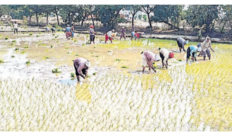
ఖానాపూర్ : సత్తనపెల్లి శివారులో వరినాట్లు వేస్తున్న రైతు కూలీలు

నిర్వహణ, డిసెంబర్ 22 : నిర్వహణ పట్టణంలో విద్యుత్ సరఫరాలో అంతరాయం నెలకొంటుందని విద్యుత్ శాఖ డీఈ నాగరాజు ప్రకటనలో తెలిపారు. పట్టణంలోని అగ్రా కాలనీ, విజయనగర్ కాలనీలో అంతరాయం ఉంటుందని వినియోగదారులు సహకరించాలని తెలిపారు.