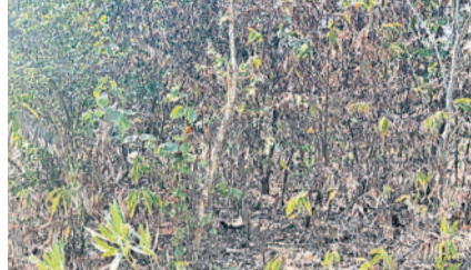
బజార్ హత్తూర్ మంజారం తండాలోని ప్రకృతి వనంలో ఎండిపోతున్న మొక్కలు

బజార్ హత్తూర్, డిసెంబర్ 22 : బజార్ హత్తూర్ మండలంలోని మంజారం తండా గ్రామంలోని పల్లెప్రకృతి వనంలోని మొక్కలు ఒక పక్క నీటి వసతి లేక ఎండిపోతున్నా పట్టించుకున్న నాభుడే కరువయ్యారు. మొక్కలను పెంచు పర్యావరణాన్ని రక్షించు అనే మాటలు కేవలం మాటలు వరకే అని చేతలో కాదని నిరూపిస్తున్నారని అధికారులు. గతంలో సర్పంచుల పదవీ కాలంలో పర్యవేక్షణ ఉండేదని, ప్రత్యేకాధికారులు పాలనలో ప్రకృతి వనంపై అధికారులు చిన్నచూపు చూస్తున్నారని ప్రజలు అసహనం వ్యక్తం చేస్తున్నారు. కొన్ని రోజులుగా ప్రకృతి