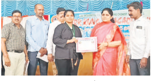
యువతకి పురస్కారాన్ని అందజేస్తున్న జిల్లా రాజకీయ శాఖ (వైల్)

ఆమెకు భరోసా దొరికింది. ఆత్మరక్షణ పెరుగుతున్నది. మహిళలు, విద్యార్థినులు ఆకరాణంలో తమను తాము రక్షించునేందుకు నిరసన పాల్గొని హార్టీ సంస్థ అందగా నిలబడుతుంది. ఆమెకు భద్రత కరువైంది. నిత్యం ఏదో ఒకచోట ఆకరాణం వేదించారు. చిల్లర చేష్టలతో ఒంటరిగా వెళ్లలేని పరిస్థితి నెలకొన్నది. ఈ క్రమంలో మహిళలు, విద్యార్థినులకు నిరసన పాల్గొని హార్టీ సంస్థ అందగా నిలబడింది. ఆకరాణంలో తమను తాము రక్షించునేందుకుగానూ కర్ర సాము, కరాటోలో ఉచితంగా శిక్షణ అందించి ధీర పనితలు నిలపాలని సంస్థ ప్రతినిధులు