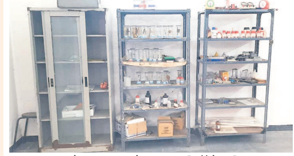
కోర్టు మండలం తల్లూరులోని కస్తూర్బా జూనియర్ కాలేజీలో ప్రాక్టికల్ గది

జగిత్యాల, డిసెంబర్ 22 (నమస్తే తెలంగాణ): 'ప్రభుత్వ విద్యను పట్టించుకోవాలి. కాల్వారేట్, ప్రైవేట్ కాలేజీలకు దీనిని పోటీగా వాడటం సంస్కారం. ప్రతి ప్రభుత్వ జూనియర్, డిగ్రీ, పీజీ కాలేజీలో కాదు. విద్యా సంస్థ ఏదైనా సరే వాటన్నింటికీ ఆపన్నత సౌకర్యాల కల్పించి, విద్యార్థులకు నాణ్యమైన, ప్రయోగాత్మకమైన, పరిశీలనాత్మకమైన, గణాంకమైన విద్యను అందిస్తాం' అంటూ ప్రభుత్వం ప్రజాప్రతినిధులు ప్రసంగాలు చేయడమే గానీ క్షేత్రస్థాయిలో అందుకు విరుద్ధమైన పరిస్థితులున్నాయని విద్యార్థులు, ఉపన్యాసకులు ఆవేదన వ్యక్తం చేస్తున్నారు. ప్రభుత్వ జూనియర్ కాలేజీలకు సంబంధించి వార్షిక పరీక్షల తేదీలు, ప్రాక్టికల్ పరీక్షల తేదీల ప్రకటన జరిగిందని, అయినా ఇంకా పరకు విద్యార్థులకు ప్రాక్టికల్స్ పూర్తిస్థాయిలో నిర్వహించే పరిస్థితిలో లేమని తెలిపారు. ఆవేదన వ్యక్తం చేస్తున్నారు. మరోవైపు తమ బతుకులు ఇంటేనేనీ, పేదరికంలో పుట్టినందుకు ఎందుకూ పనికిరాని చదువు చదువుకోవాల్సిందేనని, కనీసం ప్రాక్టికల్స్ సైతం పూర్తిస్థాయిలో నేర్పాటు చేసే స్థితి లేదని విద్యార్థులు బాధపడుతున్నారు. విద్యార్థుల సమస్యల పూర్తిగా గడిచిపోతున్నా. ఒక వైపు ప్రాక్టికల్ పరీక్షలకు కావాల్సిన సౌకర్యాలను పిల్లలతో తెలిపారు రాజీవులు, క్షేత్రస్థాయిలో మాత్రం ప్రయోగాలు నిర్వహించేందుకు మెటీరియల్ కొరత నెలకొనడంపై సర్కారు నిరసన వ్యక్తం చేస్తున్నారు.