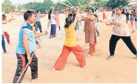
కర్రసాములో శిక్షణ పొందుతున్న యువతులు, బాలికలు (వైల్)

నేటి కాలంలో మహిళలకు భద్రత కరువైంది. నిత్యం ఏదో ఒకచోట ఆకరాణం వేదించారు. చిల్లర చేష్టలతో ఒంటరిగా వెళ్లలేని పరిస్థితి నెలకొన్నది. ఈ క్రమంలో మహిళలు, విద్యార్థినులకు నిరసన పాల్గొని హార్టీ సంస్థ అందగా నిలబడింది. ఆకరాణంలో తమను తాము రక్షించునేందుకుగానూ కర్ర సాము, కరాటోలో ఉచితంగా శిక్షణ అందించి ధీర పనితలు నిలపాలని సంస్థ ప్రతినిధులు