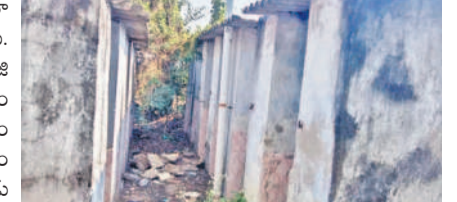
ప్రమాదకరంగా పాత నిర్మాణాలు

మొగుళ్లపల్లి, డిసెంబర్ 22 : వసతి గృహంతోపాటు చుట్టూ పరిసరాలు శుభ్రంగా ఉన్నప్పుడే విద్యార్థులు ఆరోగ్యకరమైన పాతా సంస్కారంతో చదువుకోగలుగుతారు. కానీ, జయశంకర్ భూపాలపల్లి జిల్లా మొగుళ్లపల్లి మండల కేంద్రంలోని బీసీ బాలల వసతి గృహం సమస్యలకు నిలయంగా మారింది. విద్యార్థులు తీవ్ర ఇబ్బందిపడుతున్నారు. వసతి గృహం నుంచి వచ్చే మురుగు నీరు బయటికి వెళ్లడానికి సరైన సదుపాయం లేక, పక్కనే ఉన్న పంట చేల లోకి వెళ్తున్నది. దీంతో తమ పంట చేస్తున్న వారు మురుగు నీరు పంట చేస్తున్నప్పుడు పంట పచ్చి హాల్లో దుర్బంధం వెదజల్లి విద్యార్థులు అపవలన పడుతున్నారు. హాస్టల్ చుట్టూ పూర్తి స్థాయిలో ప్రహారీ లేకపోవడంతో మూగజివాలు లోనికి స్వైరహారం చేస్తున్నాయి. అలాగే వసతి గృహంలో నూతన స్నానపు గదులు, మురుగుదొడ్లు నిర్మించారు కానీ, వాటిని ఆనుకొని ఉన్న పాత నిర్మాణాలను తొలగించకపో