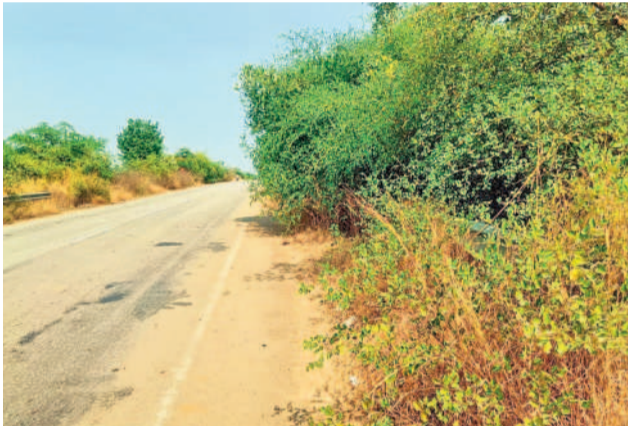
ఏటూరునాగారం వద్ద జాతీయ రహదారిపైకి చెట్లు రావడంతో కనిపించిన రెయిలింగ్

లిథియం సహా ఇతర ఖనిజ తవ్వకాలపైనూ సింగరేణి దృష్టిపెట్టింది. జియోటెక్నాలజీ, గ్రీన్ హైడ్రోజన్, అమెనియం నైట్రేట్ తయారీకి వర్షాలు చేపట్టింది. టీజీ టెక్నోలో కలిసి రామగుండంలో కొత్త డిప్లొమీ విద్యుత్తు ప్రాజెక్టును నిర్మించనున్నది. రాజస్థాన్లో సోలార్ ఫ్యాంట్ను నిర్మించనుంది. ఇంతటి పునశ్చిన్ కలిగిన సింగరేణిని పలు సమస్యలు వెన్నాడుతున్నాయి.