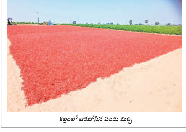
కల్లాలో ఆరబోసిన పండు మిర్చి

వాషింగ్, డిసెంబర్ 22 : మండలంలోని చండ్రుపట్ల గ్రామంలో మిర్చి కోతలు ప్రారంభమయ్యాయి. మార్కెట్లో ఎండు మిర్చికి మంచి డిమాండ్ ఉండడంతో మండల వ్యాప్తంగా రైతులు పెద్ద ఎత్తున మిర్చి పంట సాగు చేశారు. ముందుగా సాగు చేసిన చండ్రుపట్ల రైతుల పంట కోతకు వచ్చింది. దీంతో మిర్చి పంట కోసే కల్లాలో ఆరబోయడంతో ఎర్ర తివాచీలా కనిపిస్తున్నది.