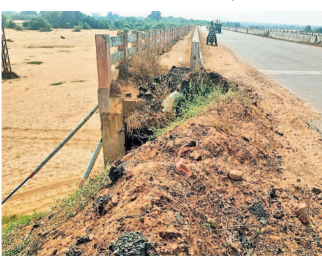
జంపన్నవూగు బ్రీడ్జి పుటిపాత వద్ద దెబ్బతిన్న రోడ్డు

ఏటూరునాగారం, డిసెంబర్ 22 : ములుగు జిల్లా ఏటూరునాగారం జాతీయ రహదారి ప్రమాదకరంగా మారి నిత్యం ప్రమాదాలు జరుగుతున్నాయి. ఏటూరునాగారం మండల కేంద్రం నుంచి ముల్లకల్లి బ్రీడ్జి వరకు అనేక చోట్ల రోడ్డుకు ఇరువైపులా చెట్లు, ముళ్ల పొదలు పెరిగి రోడ్డును కమ్మేశాయి. ఇంకా అనేక చోట్ల రోడ్డుకు ఇరువైపులా, వాగులపై ఉన్న బ్రీడ్జిలకు రెండు వైపులా ఏర్పాటు చేసిన రేలింగ్ విరిగి, పుటిపాతలు కొట్టుకుపోయి ఇబ్బందికరంగా మారాయి. ఇసుక లారీలు ఓవర్లోడితో వెళ్లడం వల్ల రోడ్డుపై దారి పాడవుతుంది. గుంతలు పడి వాహనదారులకు సరకర చూపిస్తున్నాయి. అయితే, రేలింగ్ పై పెరిగిన రేగు చెట్ల పండ్ల కోసం ప్రయాణికులు రోడ్డు పక్కనే ఆగినప్పుడు ప్రమాదాలు జరుగుతున్నాయి. నాలుగు రోజుల క్రితం రేగుపండ్ల చెట్ల వద్ద ఆగియున్న మండల