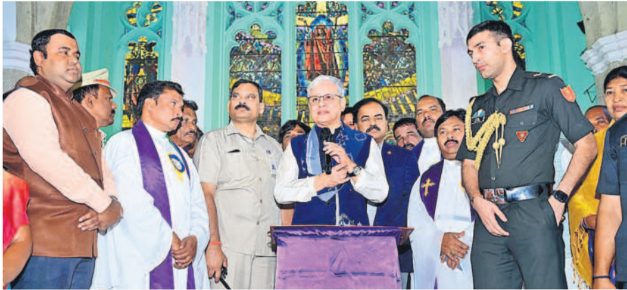
మెదక్ చర్చిలో మాట్లాడుతున్న గవర్నర్ జిష్ణుదేవ్ వర్మ