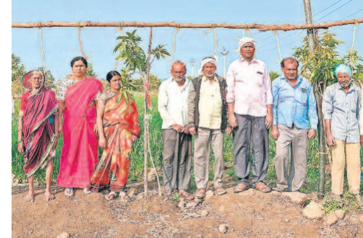
కాంగ్రెస్ ప్రభుత్వం రైతులను ఉత్సాహంతో నిమగ్నం చేసిన వివేకానంద అలాబాద్ జిల్లా ముఖ్యమంత్రి గ్రామస్థాయి నిరసన

పాత వీఆర్వోలకు మళ్ళీ పిలుపు వీఆర్వోల నియామక ప్రక్రియ పునరావృతం చేయాలని ప్రభుత్వం పిలుపునిచ్చింది. వీఆర్వోలను నియామకంపైనూ దృష్టి కొత్త వ్యవస్థ సర్వీస్ రూల్స్ పై అన్వేషణ తర్జనభర్తన పడుతున్న ఉద్యోగులు హైదరాబాద్, డిసెంబర్ 23 (నమస్తే తెలంగాణ): గ్రామాల్లోకి మళ్ళీ వీఆర్వోలు రావాలన్నాడు. ఇటీవల అసెంబ్లీ ఆమోదించిన భూ భారతీ బిల్లు లో కొత్తగా గ్రామస్థాయిలో రెవెన్యూ అధికారులను నియామకంపైనూ దృష్టి తెలిపిన సంగతి తెలిసింది. ఈ మేరకు ప్రభుత్వం మళ్ళీ వీఆర్వో వ్యవస్థను అమలు చేసేందుకు ప్రయత్నాలు ప్రారంభించింది. గ్రామాల్లో పనిచేసేందుకు రెవెన్యూ అధికారుల నియామకానికి కనీసం మొదలుపెట్టింది. సర్వేయర్ల 2వ పేజీలో