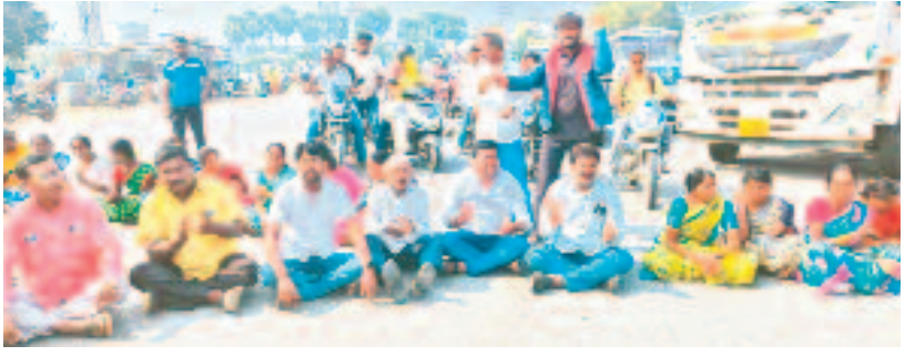
చింతకుంట గ్రామాన్ని కరీంనగర్ కార్పొరేషన్లో విలీనం చేయడంతో చింతకుంట కెనాల్ వద్ద రాస్ట్రాకోక్ చేస్తున్న గ్రామస్థులు