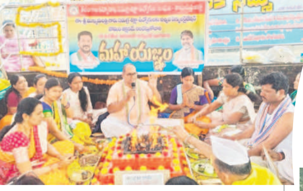
కామారెడ్డిలో యజ్ఞం చేస్తున్న సమగ్రశిక్ష ఉద్యోగులు

తమ డిమాండ్లను నెరవేరాలని కోరుతూ సమగ్ర శిక్ష అభియాన్ ఉద్యోగులు చేపట్టిన నిరవధిక సమ్మె 14వ రోజుకు చేరుకున్నది. సమ్మెలో భాగంగా సోమవారం నిజామాబాద్ లో వంట-వార్డు, కామారెడ్డిలో హోమం నిర్వహించి నిరసన తెలియజేశారు. ఈ సందర్భంగా వారు మాట్లాడుతూ.. హాన్యకోడల్ సీఎం రేవంత్ ఇచ్చిన హామీ తాము నిర్వహించిన యజ్ఞం ద్వారా గుర్తుకొచ్చినట్లు కోరారు. తమ సర్వీసును రెగ్యులర్ చేయాలని, అప్పటి వరకు పేన్సల్ అమలు చేయాలని డిమాండ్ చేశారు. సమగ్ర శిక్ష ఉద్యోగులు తీవ్రమైన పనిభారం, ఒత్తిడితో పనిచేస్తున్నారని, ఇప్పటికే ప్రభుత్వం మేల్కొనాలని కోరారు. ఎన్నికల ముందు ఇచ్చిన హామీలను తక్షణమే నెరవేర్చాలన్నారు. -కంత్వేల్/ కామారెడ్డి, డిసెంబర్ 23