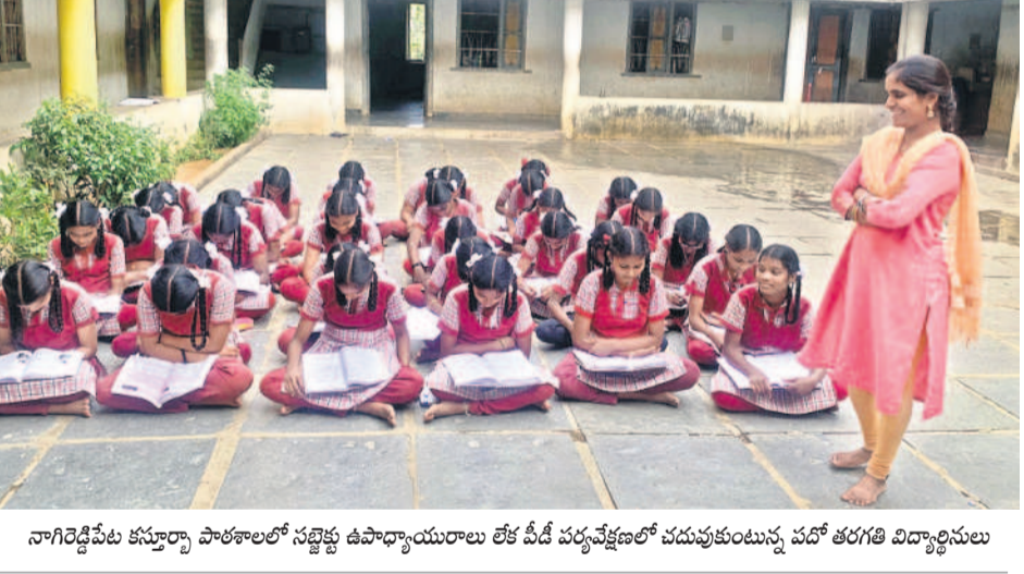
నాగిరెడ్డిపేట కస్తూర్బా పాఠశాలలో సబ్జెక్టు ఉపాధ్యాయులూ లేక వీడి చర్యవేణలో చదువుకుంటున్న పదో తరగతి విద్యార్థినులు

జరిమానాలపై ఉన్న శ్రద్ధ.. ఇసుక వాహనాలపై ఏదీ? నిజామాబాద్ పోలీసు కమిషనరేట్ పరిధిలో గత సీపీ కాలం నుంచి హెల్మెట్ ధరించకపోవడం తోపాటు ప్రజల ప్రయోజనం వేరేమీ చేసే నియంత్రణలోనే వైకే వాహనాలపై ఎడాపెడా జరిమానాలను పోలీసులు విధిస్తున్నారు. హెల్మెట్ పెట్టుకోకపోతే భారీగా జరిమానాలు విధిస్తున్న సమయంలో నబల్ ప్లేట్ లేకుండా ఇసుక, మొరం వాహనాలు నగరంలో చక్కర్లు కొడుతుంటే ఎందుకు పట్టించుకోవడం లేదని ప్రజలు ప్రశ్నిస్తున్నారు. దీనికోసం మైనింగ్ శాఖ అనుమతులు మంజూరు చేయని బాల్కొండ నియోజకవర్గంలోని మోర్లాడ్, టీమగల్, బాన్సువాడ నియోజకవర్గంలోని పోతగల్, బోధన్ నియోజకవర్గ కేంద్రంలో ఇసుక మేలలను కొల్లగొడుతున్న అక్రమార్కులపై ఖాకీలు ఎందుకు దృష్టి సారించడంలేదు. అధికార పార్టీ నేతలకు పోలీసు ఉన్నతాధికారులతో కొమ్ము కాన్పు ఇసుక అక్రమ రవాణాకు సహకరిస్తున్నారనే ఆరోపణలు వెల్లువెత్తుతున్నాయి. మోర్లాడ్ పోలీస్ స్టేషన్ ఎదుట నుంచే ఇసుకాసురులు ఇసుకను బాన్సువాడ్ రుమ్మి. రుమ్మి మంటూ తరలివచ్చడం గమనార్హం. బీర్కూర్ లోనూ పోలీస్ కాణా ఎదుట నుంచి అక్రమంగా ఇసుక తరలిస్తున్నా అడ్డుకునే నాథుడు కరువయ్యాడు.