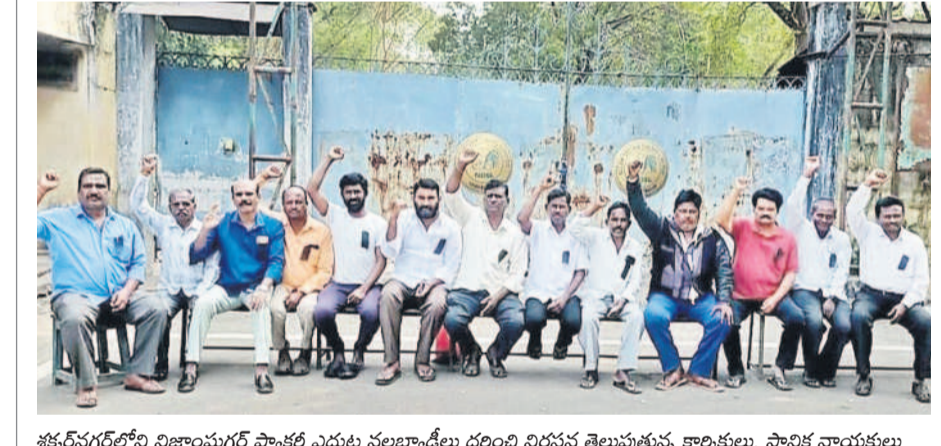
శర్వినగర్‌లోని నిజాంపూర్ పాక్షిక ఎదుట నల్లబ్యాండ్ల ధరించి నిరసన తెలుపుతున్న కార్మికులు, స్థానిక నాయకులు