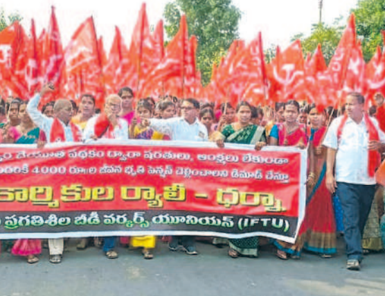
కామారెడ్డిలో నిర్వహించిన భారీ ర్యాలీలో పాల్గొన్న బీడీ వర్కర్ల యూనియన్ నాయకులు, బీడీ కార్యకర్తలు