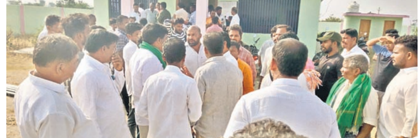
బిజినెస్ పర్సన్లకు పంపిణీ చేసే స్ప్రింగ్లర్ల కార్యక్రమం

బిజినెస్ పర్సన్లకు, డిసెంబర్ 23 : మండల కేంద్రంలోని రైతు వేదికలో రైతులకు సబ్సిడీ పంపిణీలో గందరగోళం నెలకొన్నది. స్థానిక ఎమ్మెల్యే రాజేంద్ర రెడ్డి సబ్సిడీ పంపిణీలో గందరగోళం కొనసాగింది. రైతులకు అందజేసే వెళ్లిపోయారు. ఆ తర్వాత గ్రామ, మండల కాంగ్రెస్ నాయకులు స్ప్రింగ్లర్ల పంపిణీలో గందరగోళం చూశారు. గ్రామంలోని కీలక నేతలకు తెలియకుండానే పంపిణీ పిలిచి ఇష్టానుసారంగా ఎలా అందజేస్తారో నన్ను. దీంతో అక్కడనుండి కార్యక్రమం మధ్య కొద్ది సేపు వాయిదా వేసుకున్నది. పెద్ద గ్రామాలకు