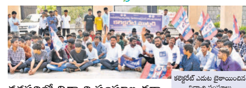
కల్లెరెట్టి ఎదుట బైరాయింబిన విద్యార్థి సంఘాలు