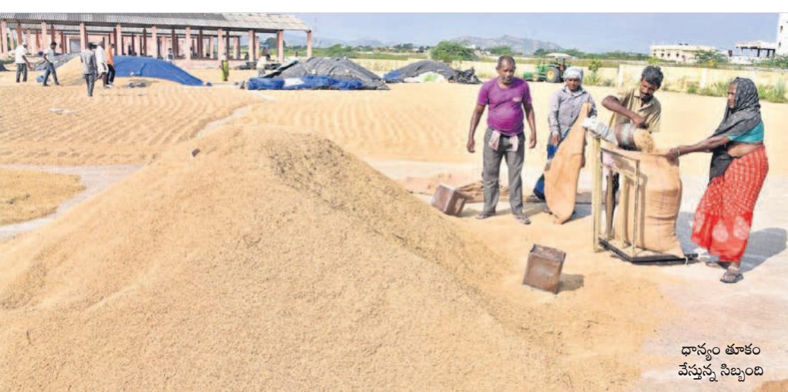
ధాన్యం తూకం వేస్తున్న నిబ్బంది

ఎన్నో వ్యయ ప్రయోజనం కోర్కె సాగించేసిన పంట తొలి కొచ్చాక కూడా అన్నదాతలకు అవసరం తప్పదం లేదు. దాన్యం కొనుగోలు ప్రక్రియలో వివిధ నిబంధనలు, సాంకేతిక సమస్యలకు తోడు మిల్లర్ల తీరుతో తీవ్ర ఇబ్బందులు ఎదుర్కొంటున్నారు. ఇవన్నీ చాల వన్నట్లు పంట సామ్యు చెల్లింపులో తీవ్ర జాప్యం