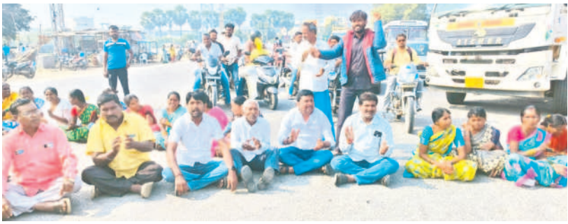
చింతకుంట గ్రామాన్ని కరీంనగర్ కార్పొరేషన్లో విలీనం చేయడంతో చింతకుంట కెనాల్ వద్ద రాస్ట్రాలోకి చేస్తున్న గ్రామస్థులు