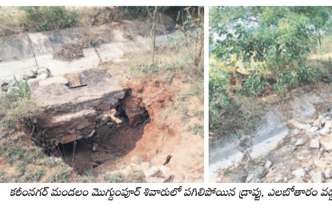
కరీంనగర్ మండలం మొగ్గంపూర్ శివారంపగలిపోయిన డ్రాఫ్టు, ఎలబోతారం వద్ద కాలవలో బండ రాళ్లు

ఎస్సారెస్సీ ఎగువ ఆయకట్టుకు నేటి నుంచి నీటిని విడుదల చేసేందుకు అంతా సిద్ధమైంది. కానీ, ప్రభుత్వం కాలవల మరమ్మత్తులు ముదిరిపోయింది. కాలవల లైనింగ్ దెబ్బతిని, అనేక చోట్ల బంగులు పడ్డాయి. పూడిక కారుకుపోయి, పిప్పిమొక్కలు పెరిగి పూర్తిగా అధ్యాసంగా మారాయి. ఈ పరిస్థితుల్లో చివరి ఆయకట్టుకు నీటిని ఎలా సరఫరా చేస్తారనని ప్రశ్నార్థకంగా మారింది. కాలవలు బాగు చేయకుండా నీరుంచివడం గగనమేనని తెలుస్తుండగా, ప్రణాళిక లేని ప్రభుత్వంపై రైతాంగం మండిపడుతున్నది. ఆన్, ఆఫ్ పద్ధతిలో నిలస్రామని, ఆఫ్ పద్ధతి అమలులో ఉన్నప్పుడు మరమ్మత్తులు చేస్తామని అధికారులు చెబుతుండగా.. ఎలా సాధ్యమని ప్రశ్నిస్తున్నది.