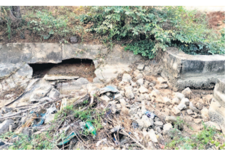
కరీంనగర్ మండలం ఎలబోతారం వద్ద దెబ్బతిన్న డి-89 ప్రధాన కాలవ

గర్ మండలంలోని గోపాల్ పూర్, దుర్గేడ్, చేగర్లి, బొమ్మ కల్ గ్రామాలకు సాగునీరు అందుకున్నది. కొత్తపల్లి మండలం మల్లాపూర్ నుంచి ప్రారంభమయ్యే ఈ కాలవ రేకుల్, ఆరెపల్లి, తీగలగుట్టపల్లి, పల్లంపహాడ్ వరకు ముగిసిన నీరును అనేక చోట్ల పలుచేసింది. ఆక్రడీ వరకు బాగానే ఉన్న కాలవ ఆ తర్వాత అధ్యాస పరిస్థితిలో ఉంది. ప్రారంభమయ్యే ఈ కాలవ రేకుల్, ఆరెపల్లి, తీగలగుట్టపల్లి, పల్లంపహాడ్ వరకు ముగిసిన నీరును అనేక చోట్ల పలుచేసింది. ఆక్రడీ వరకు బాగానే ఉన్న కాలవ ఆ తర్వాత అధ్యాస పరిస్థితిలో ఉంది.