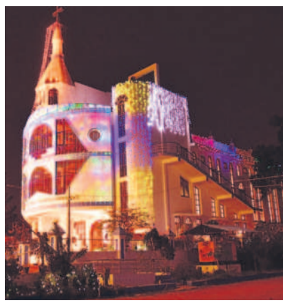
ముస్తాబైన క్రిస్టియన్ కాలనీలోని చర్చి