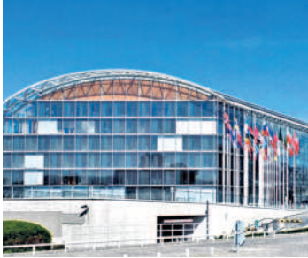
అంతర్జాతీయ సౌర కూటమిలో కొత్తగా మార్డ్వా చేరింది.

ప్రపంచ ఆరోగ్య సంస్థ • ఏటా జనవరి 10న 'అయుష్ మెడికల్ కోడింగ్ అండ్ రికార్డింగ్ డే'గా నిర్వహించాలని ప్రపంచ ఆరోగ్య సంస్థ నిర్ణయించింది. 2025లో తొలిసారి ఈ వేడుకను నిర్వహించనున్నారు. డెహ్రాడూన్ లో నిర్వహించిన పదో ప్రపంచ అయుర్వేద సదస్సులో ఈ నిర్ణయం తీసుకున్నారు. అంతర్జాతీయ సౌర కూటమి • భారత్ లోని గురుగ్రామ్ కేంద్రంగా పనిచేసే