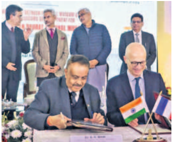
పాటు సెంట్రల్ విస్తా ప్రాజెక్టును మరింత మెరుగ్గా చేసే ఉద్దేశంతో ప్రపంచంలోనే అతిపెద్ద మ్యూజియాన్ని న్యూఢిల్లీలో నిర్మించనున్నారు. ఇందుకు ప్రాన్స్ సాయం చేయనుంది. ఈ మేరకు ఇరు దేశాల మధ్య ఒక ఒప్పందం కూడా కుదిరింది.

ఒకే దేశం ఒకే ఎన్నిక • లోక్ సభతో పాటు దేశంలోని అన్ని రాష్ట్రాల శాసనసభలకు ఒకేసారి ఎన్నిక నిర్వహించాలన్న ప్రతిపాదనతో లోక్ సభలో రెండు బిల్లులను కేంద్రం ప్రవేశపెట్టింది. లోక్ సభ, అన్ని రాష్ట్రాలకు ఒకేసారి ఎన్నికలు నిర్వహించాలంటూ ఒక బిల్లు కాగా, కేంద్ర పాలిత ప్రాంతాలకు కూడా అదే సమయంలో ఎన్నికల నిర్వహణకు సంబంధించిన మరో బిల్లును కూడా ప్రవేశపెట్టారు. 2034 నుంచి ఇది అమల్లోకి రానుంది. 129వ రాజ్యాంగ సవరణ బిల్లు ఇది. 2029 ఎన్నికల తర్వాత 'అపాయింటెడ్ డే'ను రాష్ట్రపతి ప్రకటిస్తారు. ఇది 2034లో ఉంటుంది. అక్కడి నుంచి అన్ని రాష్ట్రాల శాసనసభలు, లోక్ సభ కూడా అప్పుడే కొలువు తీరుతాయి.