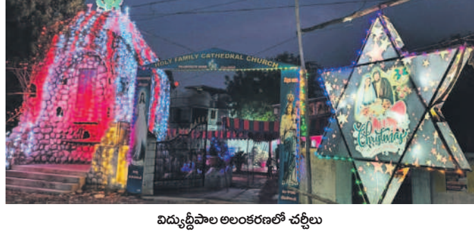
విద్యుద్దీపాల అలంకరణలో చర్చిలు

ఎదులాపురం, డిసెంబర్ 24 : లోక రక్షకుడు ఏను క్రీస్తు జన్మదినం సందర్భంగా ఆదిలాబాద్ పట్టణంలోని క్రైస్తవ ప్రార్థనా మందిరాలు ముస్తాబయ్యాయి. ఈనెల 25, 26 తేదీల్లో క్రీస్తు సంబరాలు జరగనుండగా అందుకోసం ఆయా చర్చిల్లో క్రైస్తవ మిషనరీలు భారీగా ఏర్పాట్లు చేశారు. వివిధ ప్రాంతాల్లో ఉన్న క్రైస్తవ మందిరాలను విద్యుద్దీపాలతో అందంగా అలంకరించారు. పలు చర్చిల్లో ఏను జనన వృత్తాంశాన్ని వివరిస్తూ జోహారు కొలుపులను అందంగా తీర్చిదిద్దారు. క్రీస్తుని ప్రార్థన కోసం చర్చిల్లో ప్రత్యేక ఏర్పాట్లు చేశారు. ఏను ప్రభువును ఏను క్రీస్తు జన్మదినం సందర్భంగా ఆదిలాబాద్ పట్టణంలోని క్రైస్తవ ప్రార్థనా మందిరాలు ముస్తాబయ్యాయి. ఈనెల 25, 26 తేదీల్లో క్రీస్తు సంబరాలు జరగనుండగా అందుకోసం ఆయా చర్చిల్లో క్రైస్తవ మిషనరీలు భారీగా ఏర్పాట్లు చేశారు. వివిధ ప్రాంతాల్లో ఉన్న క్రైస్తవ మందిరాలను విద్యుద్దీపాలతో అందంగా అలంకరించారు. పలు చర్చిల్లో ఏను జనన వృత్తాంశాన్ని వివరిస్తూ జోహారు కొలుపులను అందంగా తీర్చిదిద్దారు. క్రీస్తుని ప్రార్థన కోసం చర్చిల్లో ప్రత్యేక ఏర్పాట్లు చేశారు.