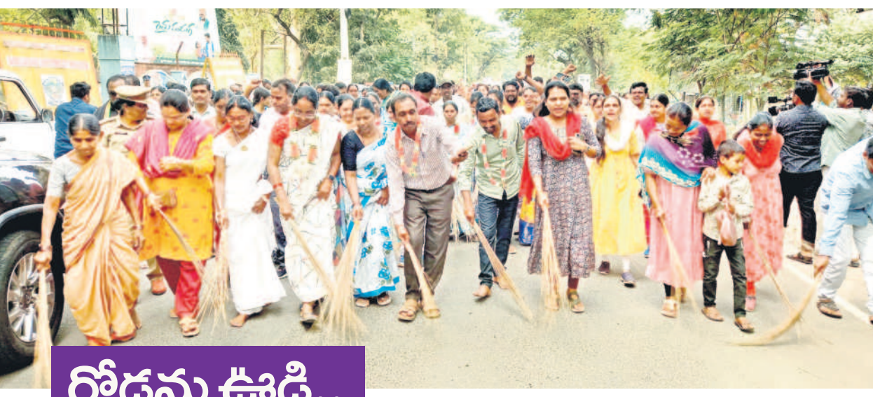
కలెక్టర్లే ఎదుట రోడ్లను ఊడుస్తూ నిరసన తెలుపుతున్న ఎన్ఎస్ఐ ఉద్యోగులు

నిబంధనల పేరిట కోతే నిబంధనల పేరిట రుణమాఫీ ఇవ్వకుండా రైతులకు మొండిచేయి చూపించాలో.. అదే తరహాలో రైతు భరోసా పథకాన్ని కొందరికీ వర్తింప చేస్తారని సమాచారం. పీఎం కిసాన్ సర్వే నిధి నిబంధనలే రైతు భరోసాకు వర్తింప చేస్తే దాదాపు గతంలో 70 లక్షల మందికి ఇచ్చిన రైతుబంధు 30 లక్షల మందికి ఇస్తే సరిపోతుంది. ప్రతి సీజనుకు అప్పుడు రూ.15 వేల కోట్లు ఖర్చుపెడితే ఇప్పుడు కేవలం సీజనుకు 5 వేల కోట్లు లోపు ఇస్తే సరిపోతుంది భావిస్తున్నది. ఈ విషయాన్ని నేరుగా చెప్పలేక సీఎం రేపాటిరెడ్డి గుట్టలు, బండరాళ్లు, రోడ్డు రైతులను ఇచ్చారంటూ ముందే కవర్ చేసుకున్నారు.. తాము చేసే మోసాన్ని కప్పి పుచ్చి ప్రతిపక్షంపై విమర్శలతో సరిపెట్టారని విశ్లేష