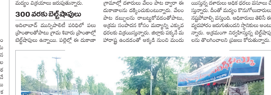
రోడ్డుపైన పాలాలు బోధించి..

నిర్మల్ వడ్డనులోని ఆల్ఫీన్ కార్యాలయం ఎదుట గల ఎస్ఎస్ఆర్ ఉద్యోగి, ఉపాధ్యాయుల నిరసనలకు నమ్మే బుధవారం నాటికి 16వ రోజుకు చేరుకున్నది. ఈ నిరసనలో భాగంగా రోడ్డుపైన పాలాలు బోధించి (రోడ్ వే న పదావో.. రోడ్ వే సి కావో) నిరసన తెలిపారు.