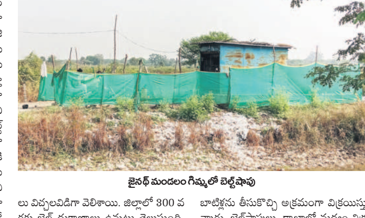
జైన్ మండలం గిమ్మలో బెల్లీపావు

300 వరకు బెల్లీపావులు ఆదిలాబాద్ మున్సిపాలిటీ పరిధిలో పలు ప్రాంతాల్లోపాటు గ్రామ శివారు ప్రాంతాల్లో బెల్లీపావులు ఉన్నాయి. పల్లెల్లో ఈ దుకాణాలు విస్తృతంగా ఏర్పడ్డాయి. అక్రమంగా మద్యం అమ్మకాలు జరుగుతున్నాయి.