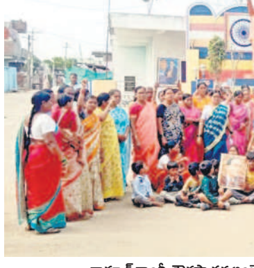
నార్కూర్ గాంధీ చౌరస్తా వద్ద అందెద్దో చిత్రపటాలతో ఆదివాసీ, దళిత సంఘాల నాయకుల నిరసన