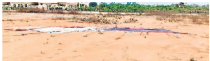
పోలీసులు తొలగించిన సమగ్ర శిక్షా అభియాన్ ఉద్యోగుల సమ్మె బిల్డింగ్

మెడకల్, డిసెంబర్ 25 (నమస్తే తెలంగాణ): ఎన్ఫీకల సమయంలో రేవంట్ రెడ్డి ఇచ్చిన హామీని నిలబెట్టేవాలని డిమాండ్ చేస్తూ మెడకల్ కలెక్టరేట్ ఎదుట గత 15 రోజులుగా సమగ్ర శిక్షా అభియాన్ ఉద్యోగులు సమ్మె చేస్తున్నారు. బుధవారం సీఎం రేవంట్ రెడ్డి పర్యటన నేపథ్యంలో కలెక్టరేట్ ఎదుట నిరసన తీరుగా రూరల్ పోలీసులు బలవంతంగా తొలగించి, ఉద్యోగులను పోలీస్ స్టేషన్ కు తరలించారు. అయితే పోలీసుల తరఫున నిరసనూ ఉద్యోగులు స్టేషన్ లోనే బైటా