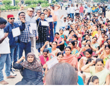
కామారెడ్డిలో సమగ్ర శిక్షణ అభియాన్ ఉద్యోగుల నిరసన

కామారెడ్డి, డిసెంబర్ 25 : డిమాండ్ సాధన కోసం సమ్మెకు దిగిన సమగ్ర శిక్షణ అభియాన్ (ఎస్ఎస్ఎం) ఉద్యోగులు బుధవారం కామారెడ్డిలో వినూత్న రీతిలో నిరసన కార్యక్రమం చేపట్టారు. రోడ్డుపైనే పాఠాలు చెబుతూ ప్రభుత్వానికి తమ నిరసనను తెలిపారు. 16 రోజులుగా సమ్మె చేస్తుండడంతో విద్యా వ్యవస్థలో అన్ని పనులు నిలిచిపోయాయని, బోధనల ఆగిపోయిందని, అయినా ప్రభుత్వం స్పందించక పోవడం దారుణమని ఎస్ఎస్ఎం ఉద్యోగులు తెలిపారు.