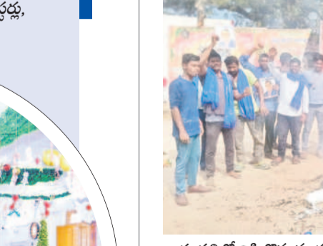
దూపల్లిలో బిష్టిబొమ్మల దహనం చేస్తున్న మాల ప్రతినిధులు

రెంజిల్, డిసెంబర్ 25 : రాజ్యాంగ నిర్మాత బాబాసాహెబ్ అంబేద్కర్ రిఫై అనుచిత వ్యాఖ్యలు చేసిన కేంద్ర హోం మంత్రి అమిత్ షాను బర్సరేడ్ చేయాలని డిమాండ్ చేస్తూ దళిత సంఘాలు బుధవారం పలుచోట్ల ఆందోళనలు చేపట్టాయి. రెంజిల్ మండలం దూపల్లిలో మాల మహానాడు ఆధ్వర్యంలో, ఆర్కాట్లో దళిత బహుజన అభ్యుదయ సంఘాల ఆధ్వర్యంలో నిరసన కార్యక్రమాలు నిర్వహించాయి. కేంద్ర మంత్రి అమిత్ షా డిష్టిబొమ్మలను దహనం చేశారు. అమిత్ షా తన వ్యాఖ్యలను వెనక్కు తీసుకుని క్షమాపణ చెప్పాలని లేకపోతే ఆయనను ప్రధాని మోదీ బర్సరేడ్ చేయాలని డిమాండ్ చేశారు.