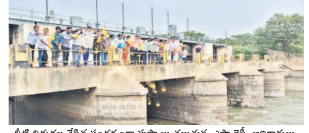
నీటి విడుదల చేసిన సందర్భంగా పుష్కల పట్టణంపై ఎస్సారెస్సీ అధికారులు

కామారెడ్డి, డిసెంబర్ 25 : డిమాండ్ సాధన కోసం సమ్మెకు దిగిన సమగ్రశిక్షణ అభియాన్ (ఎస్ఎస్ఎం) ఉద్యోగులు బుధవారం కామారెడ్డిలో వినూత్న రీతిలో నిరసన కార్యక్రమం చేపట్టారు. లోడ్లుపైనే పాఠాలు తెలుతూ ప్రభుత్వానికి తమ నిరసనను తెలిపారు. 16 రోజులుగా సమ్మె చేస్తుండడంతో విద్యా వ్యవస్థలో అన్ని పనులు నిలిచిపోయాయని, బోధన అగిపోయిందని, అయినా ప్రభుత్వం స్పందించక పోవడం దారుణమని ఎస్ఎస్ఎం ఉద్యోగులు తెలుపారు. 16 రోజులుగా సమ్మె తాగినంత సమయంలో సమస్యలు పరిష్కరించాలని, బోధన అగిపోయిందని, అయినా ప్రభుత్వం స్పందించక పోవడం దారుణమని ఎస్ఎస్ఎం ఉద్యోగులు తెలుపారు. విద్యార్థులకు విద్యా