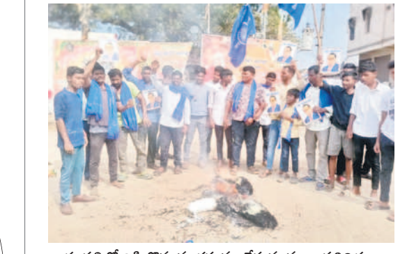
దుాపల్లిలో బిట్టోహృదయ దహనం చేస్తున్న మాల ప్రతినిధులు

యాసంగి పంటలకు ఎస్సారెస్సీ నీరు కాకతీయ, లక్ష్మి, సరస్వతి కాలువకు నీటి విడుదల మోర్రాడ్, డిసెంబర్ 25 : శ్రీరాంసాగర్ ఆయకట్టు కింద యాసంగి పంటల సాగు కోసం బుధవారం నుంచి నీటి విడుదలను ప్రారంభించారు. నిర్వహించిన ప్రత్యేక సమావేశాల్లో, రాష్ట్ర విత్తనాభివృద్ధి సంస్థ చైర్మన్ అన్నారెడ్డి, ఎస్సారెస్సీ