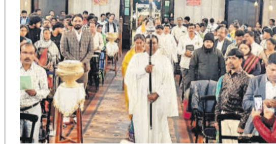
మెదక్ చర్చిలో శిలువ ఊరేగింపుతో ప్రారంభమైన క్రిస్టన్ వేడుకలు, శిలువను చర్చిలోకి తీసుకొస్తున్న మత గురువులు

మెదక్, డిసెంబర్ 25 (నమస్తే తెలంగాణ): కాంగ్రెస్ ప్రభుత్వం ఎన్నికల సమయంలో ఇచ్చిన హామీని సీఎం రేవంత్ రెడ్డి నిలబెట్టుకోవాలని డిమాండ్ చేస్తూ మెదక్ కలెక్టరేట్ ఎదుట 15 రోజులుగా సముగ్ర శిక్షా ఉద్యోగులు సమైక్యంగా ఉన్నారు. బుధవారం మెదక్ చర్చికి సీఎం రేవంత్ రెడ్డి వస్తుండడంతో మెదక్ కలెక్టరేట్ ఎదుట టింట్ వేసుకొని సమైక్యంగా సముగ్ర శిక్షా ఉద్యోగులను మెదక్ రూరల్ సీఎస్సీ తరఫిని నిర్బంధించి పదాన్ని తీవ్రంగా ఖండిస్తున్నామని మాజీ మంత్రి, సిద్దిపేట ఎమ్మెల్యే తన్నీరు హరిశ్చంద్ర రావు ఫైర్ అయ్యారు. సముగ్ర శిక్షా ఉద్యోగుల టింట్ ముందు నుంచే వెళ్తున్న ముఖ్యమంత్రి... టింట్ వేయడం కాదు, వారి