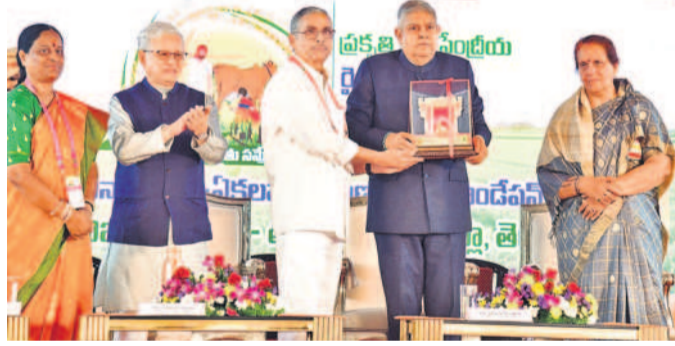
మెదక్ జిల్లా కౌడపల్లి మండల తునిలోని ఏకలవ్య కృషి విజ్ఞాన కేంద్రంలో జ్ఞాపిక అందుకుంటున్న ఉపరాష్ట్రపతి జగదీప్ ధన్ ఖాన్ దంపతులు