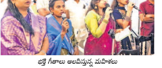
భక్తి గీతాలు ఆలపిస్తున్న మహిళలు