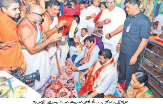
మెదక్ జిల్లా ఏడుపాయల్లో సీఎం రేవంత్ రెడ్డి, పీసీసీ అధ్యక్షుడు మహేశ్ మోహన్ గౌడ్, మంత్రులు పొంగులేటి, దామోదర, కొండా సురేఖను ఆశీర్వాదిస్తున్న ఆలయ పూజారులు

మెదక్, డిసెంబర్ 25 (నమస్తే తెలంగాణ)/పాపన్నపేట: అందరి ఆశీర్వాదం కావాలి అని సీఎం రేవంత్ రెడ్డి అన్నారు. బుధవారం క్రిస్టన్ పండుగ సందర్భంగా మెదక్ చర్చిని ఆయన సందర్శించారు. ఈ సందర్భంగా ఇన్వెస్ట్ బిజినెస్ రివెంజ్ రూపొందించుకోవాలి, ప్రైవేటీకర్ ఇన్వెస్ట్ శాంతియుక్త పునరాగ్రామీణుల పనికి ప్రత్యేక ప్రాధాన్యతలు చేశారు. అంతకుముందు పాపన్నపేట మండలంలోని వనదుర్గపాళ ఆలయాన్ని సీఎం సందర్శించారు. ఈ సందర్భంగా ఆలయ పూజారులు సీఎం సాగృతం వలికారు. ముఖ్యమంత్రి రేవంత్ రెడ్డి ఏడుపాయల వనదుర్గపాళా సన్నిధిలో వివిధ అభివృద్ధి పనులకు శ్రీకారం చుట్టారు. రెవెన్యూశాఖ మంత్రి పొంగులేటి శ్రీనివాస్ రెడ్డి, వైద్యారంగ్ శాఖ మంత్రి దామోదర రాజు సర్పంచి, అటవీ, దేవాలయ దర్బాదాయశాఖ మంత్రి కొండా సురేఖతో కలిసి ఏడుపాయల వనదుర్గపాళాని మాతకు పట్టుపట్టాలి సమర్థనలు, పూజలు నిర్వహించారు. అనంతరం మెదక్ నియోజకవర్గంలో రూ.409.58 కోట్ల పనులకు శంకుస్థాపన చేశారు. మెదక్ చర్చి అభివృద్ధికి రూ.29 కోట్లతో శంకుస్థాపనలు చేశారు. ఏడుపాయల వనదుర్గపాళాని మాత ఆలయానికి వచ్చి ప్రధాన రహదారిని రెండు వరుసల రోడ్డుతో పాటు డివైడర్ ఫ్లడైట్లను ఏర్పాటు చేశారు. 35 కోట్లు, మెదక్ జిల్లా కేంద్రంలో మహిళా శ్రీశక్తి భవన్ నిర్మాణం కోసం రూ.5 కోట్లు, గిరిజన తండాలో రవాణా సౌకర్యం కోసం రూ.52.76 కోట్లు, రూ.205 కోట్లతో యంగ్ ఇండియా, ఇంటి గ్రేడ్ పాఠశాల, ఆర్ఆండీవీ రోడ్ నిర్మాణం కోసం రూ.7.4 కోట్ల పనులకు శంకుస్థాపన చేశారు. అనంతరం వారికి జిల్లా గ్రామీణ అభివృద్ధి అధికారులు రూ.102 కోట్ల చెక్కును స్వయం సహాయక సంఘాలకు అందజేయగా బ్యాంకు లింకేజీ కోసం అధికారులు ముఖ్య