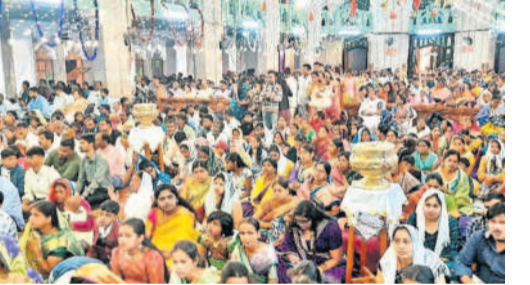
మెదక్ చర్చిలో తెల్లవారజామున నిర్వహించిన ప్రార్థనల్లో పాల్గొన్న భక్తులు