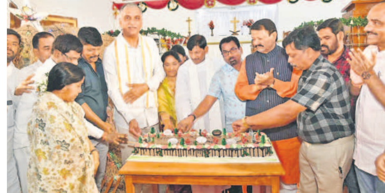
సిద్దిపేట సీఎస్సీ చర్చిలో క్రిస్టన్ పండుగం కేకే కవిత చేస్తున్న మాజీ మంత్రి, సిద్దిపేట ఎమ్మెల్యే తన్నీరు హరిశ్చంద్ర, మాజీ ఎమ్మెల్సీ ఫరూఖ్ హుస్సేన్