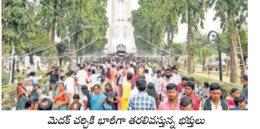
మెదక్ చర్చికి భారీగా తరలివస్తున్న భక్తులు