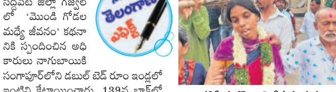
తల్లికి తలకొలిచి పెళ్లికొన కూతురు