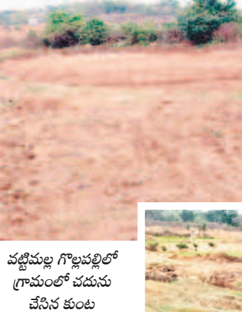
వట్టిమల్ల గొల్లపల్లిలో గ్రామంలో చదును చేసిన కుంట

వట్టిమల్ల గొల్లపల్లి గ్రామంలోని భూరవ్వకుంట కబ్బాదారులను గుర్తించుకుంటుంది. కొంత కాలంగా ఆక్రమణలతో విస్తీర్ణం 15 ఎకరాల నుంచి ఎకరానికి పడిపోయింది. వారం రోజులుగా యంత్రాలతో చదును చేస్తూ ఆక్రమిస్తున్నా వట్టిమల్లకునే దిక్కు లేకుండా పోయింది. అయితే అధికారుల చోర్యం మాడడం వల్లే ఈ దుస్థితి వచ్చిందని గ్రామస్థులు ఆరోపిస్తున్నారు.