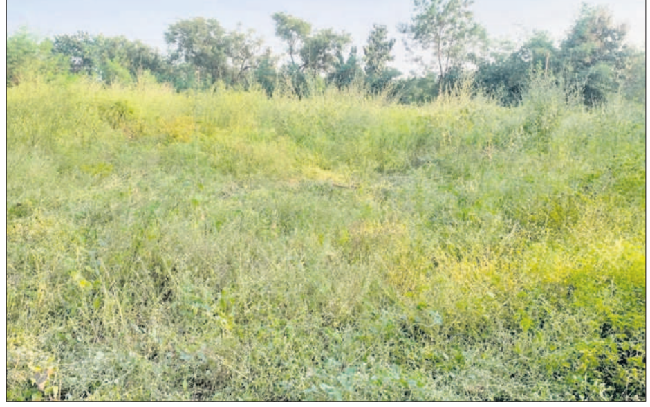
ఏడాది క్రితం ఏర్పాటు చేసిన మామిడి తోటలో పెరిగిన పిప్పిమొక్కలు

రాష్ట్ర వ్యాప్తంగా రైతులకు శిక్షణనిచ్చిన క్షేత్రం.. నేడు చూసే దుకు అధికారి కూడా లేడు. ఆరు నెలలుగా క్షేత్రానికి ఒక్క అధికారి రాలేదు. దీంతో క్షేత్రంలోని తోటలు, అంటు మొక్కలకు పర్యవేక్షణ లేక ఎండిపోతున్నాయి. క్షేత్రం పూర్తిగా గడ్డి పెరిగి అడవిని తలపిస్తోంది. దారుల్లో నడిచేందుకు వీలు లేకుండా మారింది. క్షేత్రంలోని ట్రాక్టర్లు, యంత్రాలు, సామగ్రి, బోరు