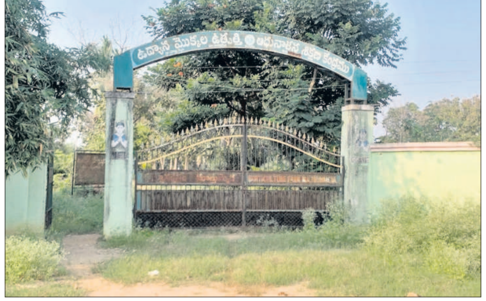
అలాపాలనా లేని మాల్కొండ పండ్ల మొక్కల ఉద్యానవన క్షేత్రం

■ ఎండిపోతున్న మొక్కలు ■ పట్టించుకోని అధికారులు ■ పూర్వ వైభవం తీసుకురావాలని కోరుతున్న ప్రజలు