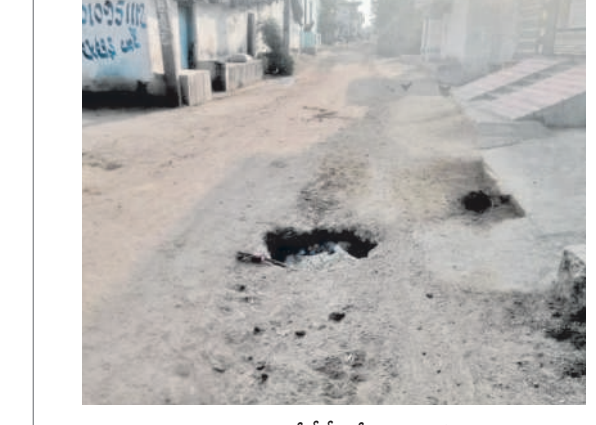
తాళ్ల రామగుర్రాలో సీసీ రోడ్డుపై ఏర్పడిన గుంత

సిరికొండ, డిసెంబర్ 26: మండలంలోని తాళ్లరామగుర్రా గ్రామంలో సీసీ రోడ్డుపై ఏర్పడిన గుంత ప్రమాదకరంగా మారింది. గ్రామంలో అదే ప్రధాన దారి కావడంతో ప్రజలు ఇబ్బందులు ఎదుర్కొంటున్నారు. కల్వర్టు కింద సీసీ రోడ్డు ఉండడంతో వాహనాలు ప్రయాణించి గుంత ఏర్పడిందని గ్రామస్థులు తెలిపారు. ద్వైచక్ర వాహనదారులు, రోడ్డుపై నడుచుకుంటూ వెళ్లేవారికి గుంత కనిపించకపోవడంతో ప్రమాదాలు జరిగి అవకాశం ఉన్నది. ఇప్పటికే అధికారులు స్పందించి వెంటనే గుంతను పూడ్చివేసి ప్రమాదాల నుంచి కాపాడాలని గ్రామస్థులు కోరుతున్నారు.