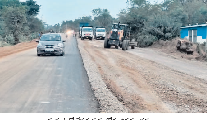
రుద్రూర్లో చేపడుతున్న రోడ్డు విస్తరణ పనులు

రుద్రూర్, డిసెంబర్ 26: మండల పరిధిలో అధిక సంఖ్యలో ప్రకారం పనులు చేపడుతున్నాయి. పనులకు అడ్డుగా ఉన్న ఇండ్లు, ఇతర కట్టడాలను తొలగించాలని ప్రజలకు ముందే వెళ్లిన జాతింబు రూపాధి విస్తరణ పనుల కోసం అధికారులు రోడ్డు మధ్యలో నుంచి