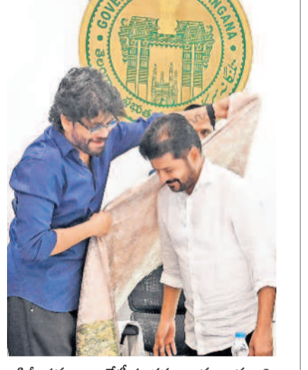
సీని ప్రముఖుల బోటీ సందర్భంగా ముఖ్యమంత్రి రేవంత్కు శాలువా కట్టుతున్న సటుడు నాగార్జున

హైదరాబాద్, డిసెంబర్ 26 (నమస్తే తెలంగాణ): రాష్ట్ర ప్రభుత్వం అమలు చేయనున్న 'భూ భారతి' చట్టం రైతుల పాలిట పడుతున్నా మారమన్నది. భూమి క్రయ విక్రయాలు జరపాలంటే సర్వే తప్పనిసరిగా చేయించాలని చట్టంలో నిబంధన విధించింది. దీంతో ఒక రైతు తన పొలాన్ని అమ్మాలంటే ముందుగా సర్వే కోసం దరఖాస్తు చేసుకోవాల్సి ఉంటుంది. ప్రస్తుతం రాష్ట్రవ్యాప్తంగా సర్వేయర్ కొరత తీవ్రంగా ఉన్నది. రెండుమూడు మండలాలకు కలిపి ఒక సర్వేయర్ కొరతగా కొనసాగుతున్నారు. ఒక్కో సర్వేయర్ వద్ద పదుల సంఖ్యలో దరఖాస్తులు పెండింగ్లో ఉన్నాయి. సర్వే కోసం మీసేవ ద్వారా దరఖాస్తు చేస్తే కనీసం మూడునెలలు వారాల తర్వాతే సర్వే చేస్తున్నట్లు రైతులు చెబుతున్నారు. ఇలాంటి పరిస్థితుల్లో ఒక రైతు ఏదైనా అత్యవసరంగా తన పొలాన్ని అమ్మడం సాధ్యమేనా? అనే చర్చ జరుగుతున్నది. ప్రస్తుతం రాష్ట్రంలో 612 రెవెన్యూ మండలాల ఉన్నాయి. ప్రభుత్వం మండలానికి ఒక సర్వేయర్ను కేటాయింబింది. 250 మంది సర్వేయర్లే > 2వ పేజీలో