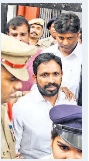
మారేడ్ పల్లిలోని తన నివాసం నుంచి ఎన్ డిఎస్ టీనివాసం అరెస్టు చేసి తీసుకువచ్చిన పోలీసులు

దళితబద్ధ ఎన్ డిఎస్ అరెస్టు కోర్టు ఆదేశాలతో విడుదల తెలంగాణ రాజకీయాలలో ఇంటికి పోలీసులు నోటీసులు ఇచ్చేందుకు చెప్పి అరెస్టు అడ్డుకున్న టిఆర్ఎస్ నేతలు, కార్యకర్తలు ప్రభుత్వానికి వ్యతిరేకంగా నిరాదాన ప్రకటనలు చేసి అరెస్టు చేయబడిన సాంకేతిక శక్తినివాస విడుదల ధర్మశు గెలిచినందుకు టిఆర్ఎస్ నేత > 3