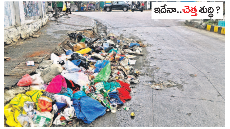
కవాడిగూడలో రహదారిపై తొలగించని వ్యర్థాలు