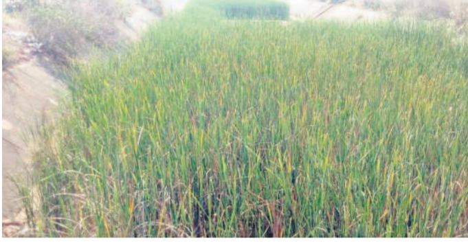
కుస్తుంభం ప్రాజెక్టు కాలువల్లో పెరిగిన గడ్డి

కుస్తుంభం అసిఫాబాద్, డిసెంబర్ 26 (నమస్తే తెలంగాణ) : జిల్లాలో కొన్నేళ్లగా పెరుగుతూ వచ్చిన యాసంగి సాగు, ఈయే దాది తగ్గవలసి పట్టింది. గత యాసంగి నీజన్లో దాదాపు 43 వేల ఎకరాల్లో వివిధ రకాల పంటలు వేయగా, ఈ యేడాది కనీసం 40 వేల ఎకరాల్లో సాగుపడుతుంది యంత్రాం గం భావించింది. కానీ, 30 వేల ఎకరాల్లోపే పంటలు వేస్తున్నట్లు తెలుస్తున్నది. కనీసం సర్కారులో 24 గంటల ఉచిత విద్యుత్, సాగు నీటి వనరులతో దర్గా పంటలు తీసిన రైతాంగం, ఈసారి మాత్రం వెనుకడుగు వేస్తున్నది. ఇప్పటికే జిల్లాలో విద్యుత్ కోతలు మొదలు కావడం.. దీనికి తోడు జిల్లాలో ప్రధాన సాగునీటి జలాశయమైన కుస్తుంభం ప్రాజెక్టులో 10 టీఎంసీల నీటి నిల్వలు బదులుగా 5 టీఎంసీల నీరు ఉండడం.. కాలువలు శిథిలావస్థకు చేరుకోవడం.. పిప్పిముక్కలు ఏ పుస్తా పెరగడంవంటి కారణాలతో యాసంగి సాగుపై రైతులు ఆసక్తి చూపడం లేదు. కనీసం కాలువల్లో ఆయిల్ ఇంజిన్లు వేసి నీటిని పెట్టుకునే అవకాశం కూడా లేదు.