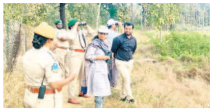
అధికారులతో మాట్లాడుతున్న టీసీసీఎఫ్, డీఎఫ్ఓ