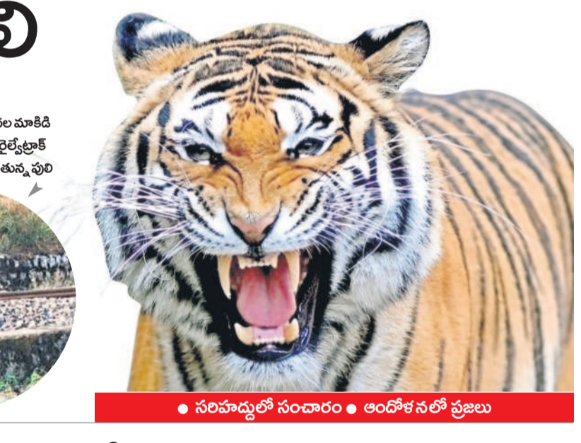
● సరిహద్దుల్లో సంచారం ● ఆందోళనలో ప్రజలు

సుమారు గత 15 రోజులుగా మారాష్ట్ర- సిర్పూర్-టి సరిహద్దుల్లో రోడ్డు దాటతూ.. రైల్వే ట్రాక్లు దాటతూ తరుచూ పులికనిపిస్తుండటంతో ప్రజలు బెబ్బలిపోతున్నారు. ఈ ప్రాంతంలో స్థావరం ఏర్పాటు చేసుకునేందుకు పులి వెతుకుతున్నట్లు తెలుస్తోంది. పులి ఎప్పుడూ ఎక్కడి నుంచి వస్తుందోనని ఈ ప్రాంతంలోని గ్రామాల ప్రజలు, చేళ్లలో పనులు చేసుకుంటున్న రైతులు తీవ్రమైన భయాందోళనలకు గురవుతున్నారు. మహారాష్ట్రలకు- దాదాపు పదికితీమీటర్ల పరిధిలో సుమారు పది గ్రామాల వరకు ఉన్నాయి. ఈ గ్రామాలకు ప్రజలు తరచుగా తరచుగా పులి సంచారం లో భయాందోళనలు చెందుతున్నారు.